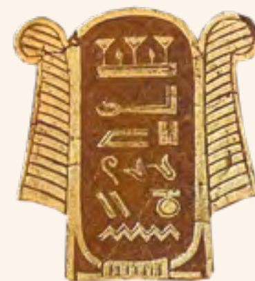
FIG. 14 BIBLIOTHÈQUE NATIONALE DE FRANCE, DÉPARTEMENT DES MANUSCRITS, NAF 20321