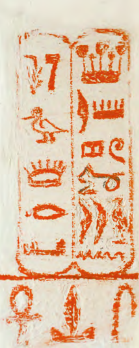
FIG. 10 DÉPARTEMENT DE L'ISÈRE / MUSÉE CHAMPOLLION