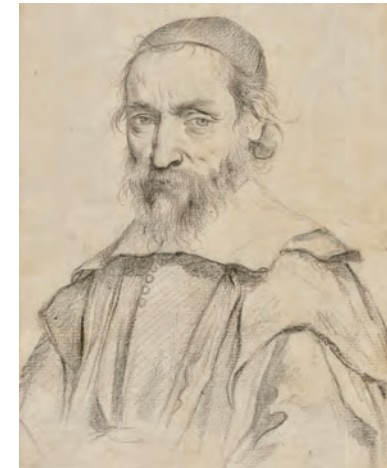
FIG. 102. PORTRAIT DE NICOLAS-CLAUDE FABRI DE PEIRESC PAR CLAUDE MELLAN EN 1636

S'il y eut sans aucun doute des découvertes de papyrus plus anciennes, la première qui soit assez précisément documentée est celle advenue en 1778, nous raconte-t-on, à Giza, près du Caire. Des fellahs déterrèrent une caisse en bois contenant une cinquantaine de rouleaux de papyrus. Ils cherchèrent à les revendre auprès d'un commerçant italien, qui n'en acheta qu'un seul. Ne sachant que faire des autres, ils les auraient