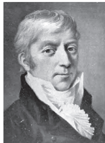
FIG. 105. JEAN- ANTOINE LETRONNE (1787-1848)