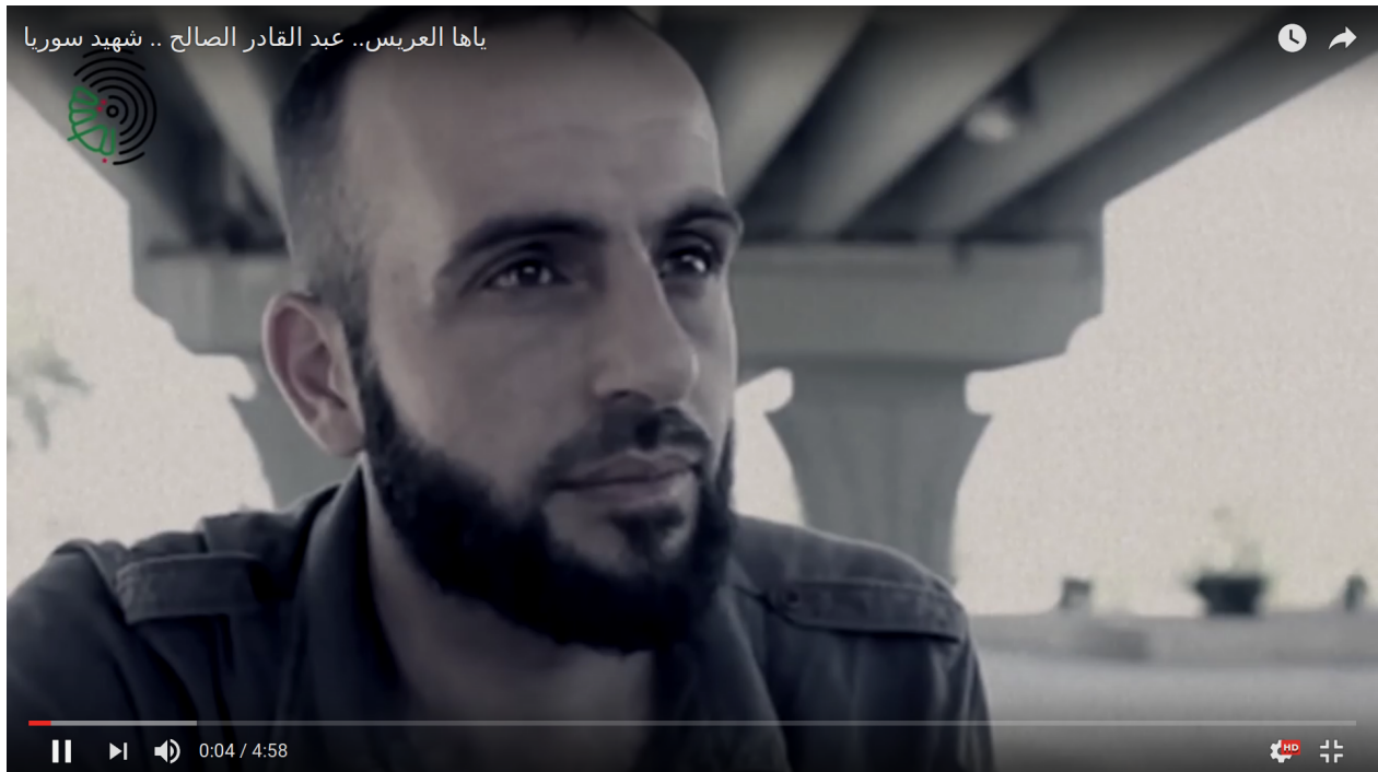
Capture d'écran « Ô toi le jeune marié. Abdel Qader al-Saleh, martyr de la Syrie », YouTube, 2013

plupart des hommages mobilisent peu de références islamiques. Les hymnes utilisés puisent aussi bien dans le registre jihadiste, la chanson populaire ou même l'hymne national syrien, rarement utilisé. On observe par ailleurs un usage prépondérant de références comme le drapeau de la révolution ou la carte de la Syrie, érigeant Abdel Qader al-Saleh en figure nationale. La diversité des hommages rendus par des individus ou des comités de coordination issus de différentes régions, atteste du désenclavement géographique de ce martyr tout comme de sa capacité à faire coexister des sensibilités laïques et islamistes. L'éclectisme des mises en récits de ce martyr emblématique éclaire, de manière plus générale, la fluidité des références tout comme la plasticité des figures de martyrs qui renvoie au faible degré d'organisation de la lutte armée tout comme à l'indétermination idéologique qui la caractérise. Pour autant, l'appartenance à un territoire, envisagée à une échelle locale ou nationale, qu'il s'agit de libérer, demeure la trame commune des récits associés à ces morts, déposés sur Internet, à défaut d'espace de commémoration officiel et commun.