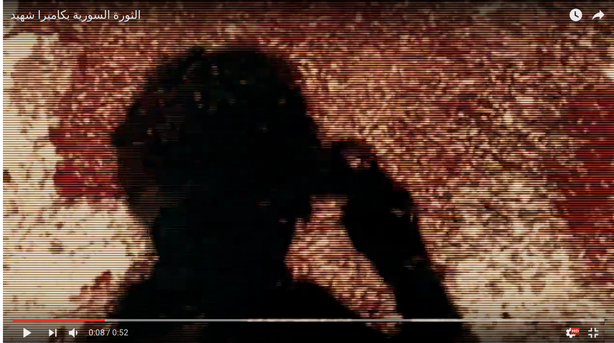
Capture d'écran « La révolution syrienne à travers la caméra d'un martyr », 2011