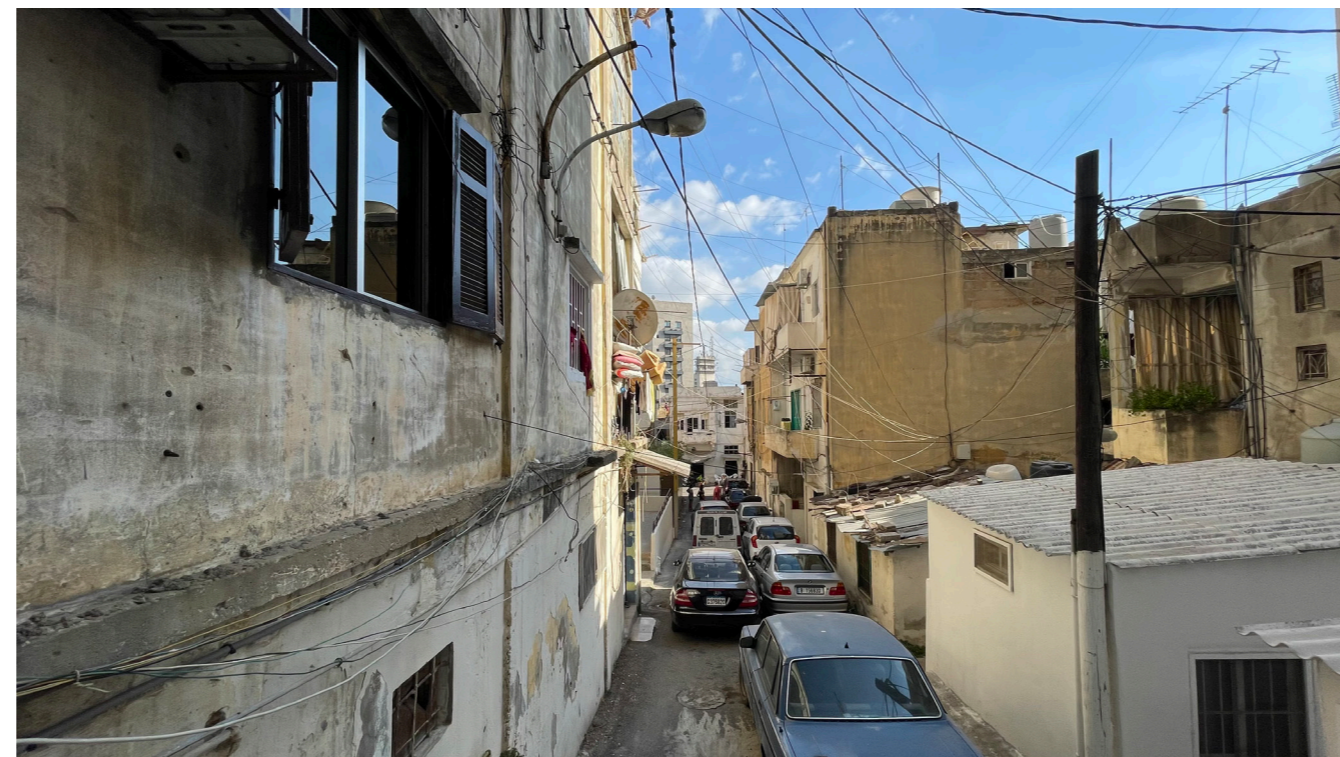
Image illustrant le cœur du quartier Syriac.