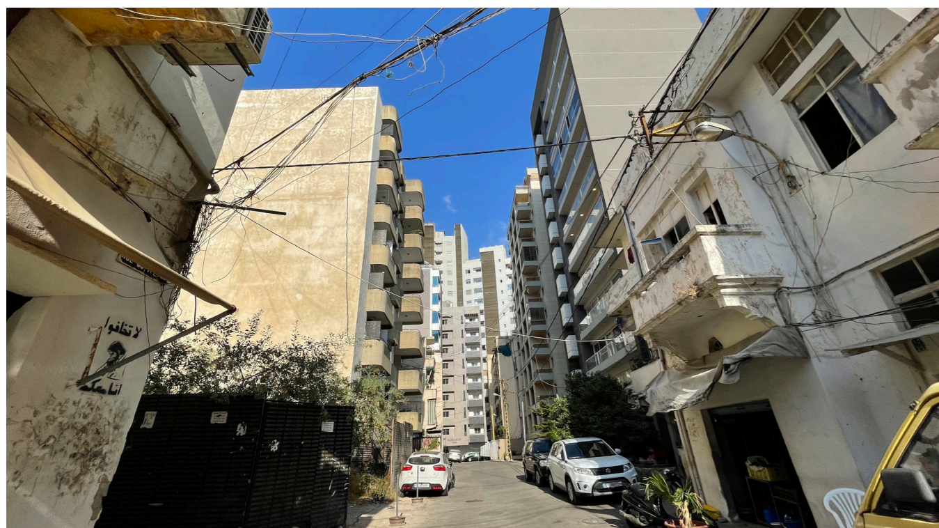
Image illustrant le cœur du quartier, la limite entre les deux zones (requalifiée et non requalifiée).