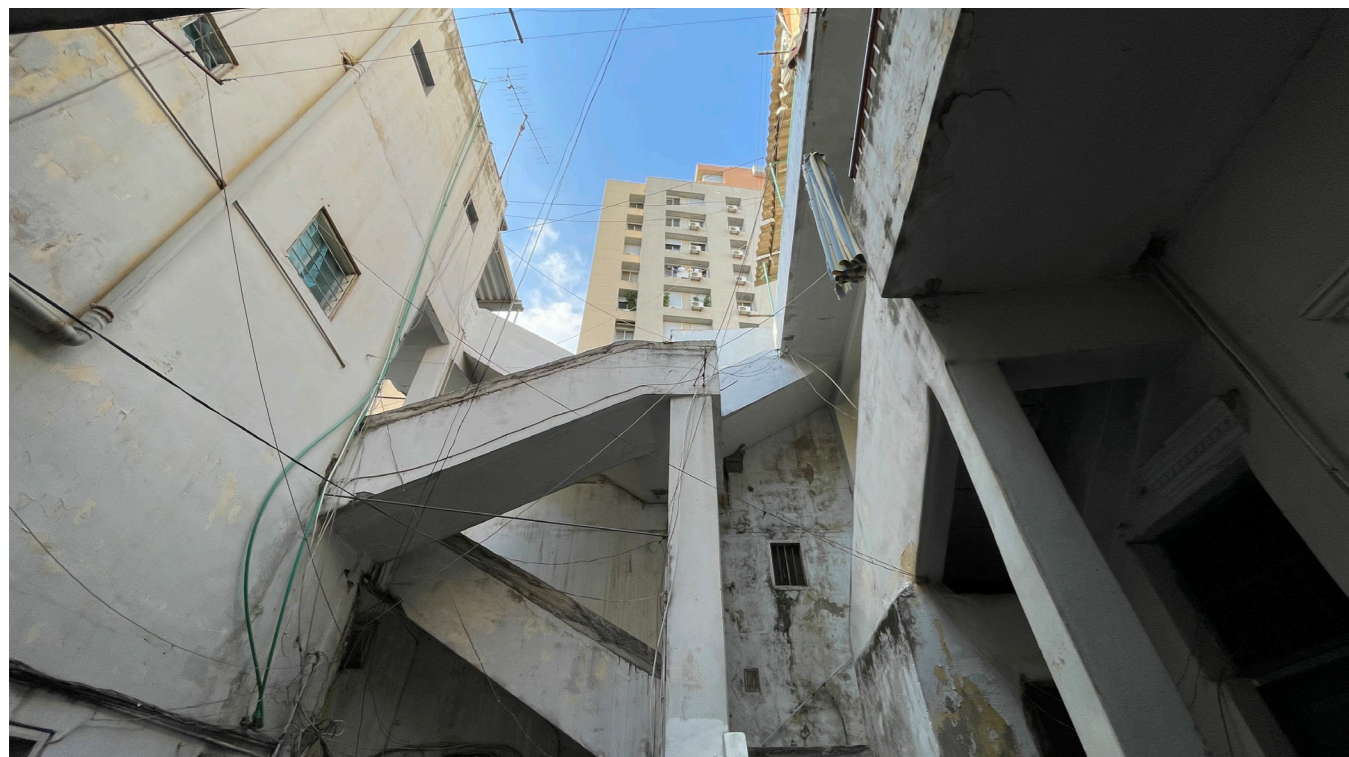
Image illustrant comment la nouvelle bâtisse bloque la vue. Vue prise du cœur central d'une ancienne bâtisse habitée.