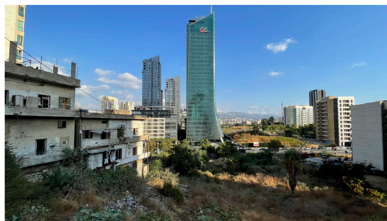
Image illustrant la lutte au sein du quartier entre deux ambiances urbaines contradictoires.