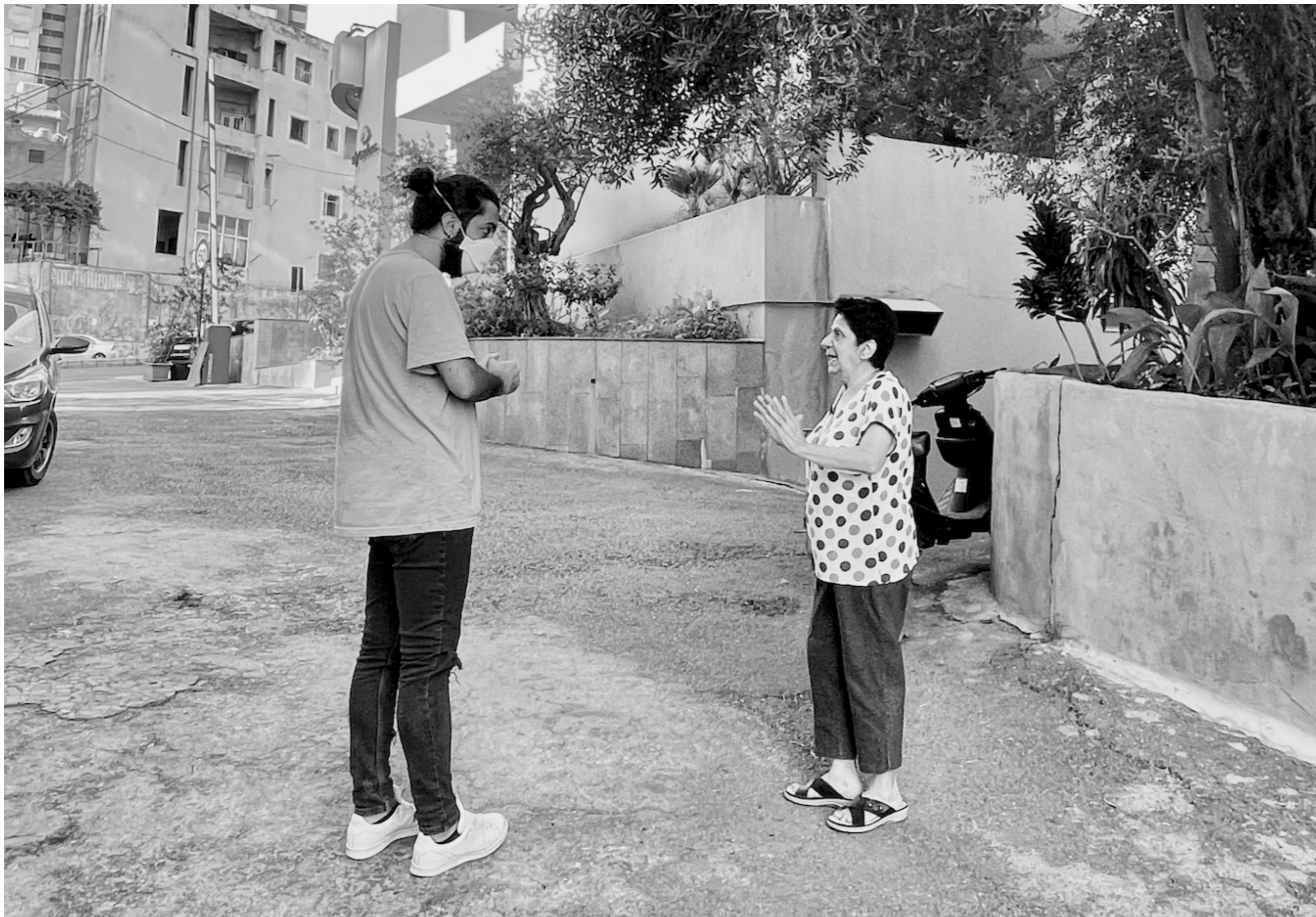
Image illustrant l'enquêteur et la personne enquêtée en action sur le terrain.