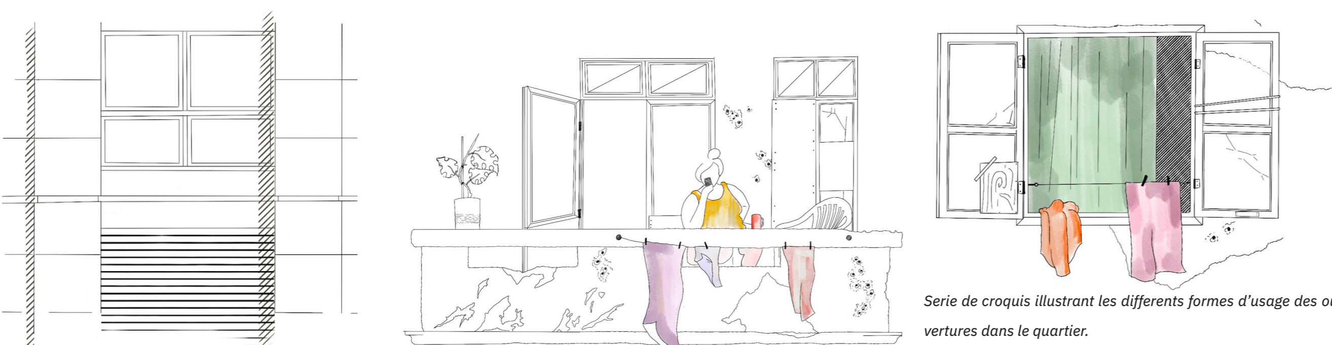
Serie de croquis illustrant les différents formes d'usage des ouvertures dans le quartier.