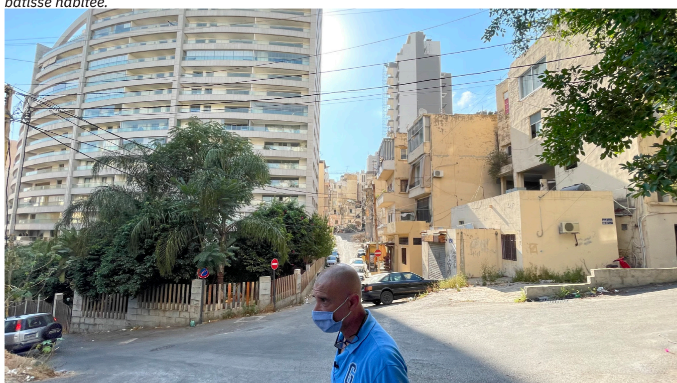
Image illustrant la lutte au sein du quartier entre deux ambiances urbaines contradictoires.