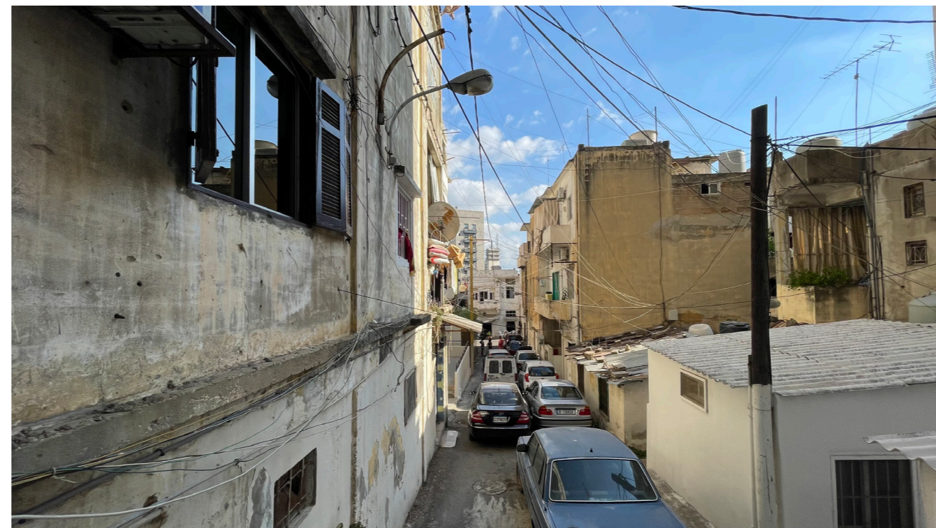
Image illustrant le coeur du quartier Syriac.