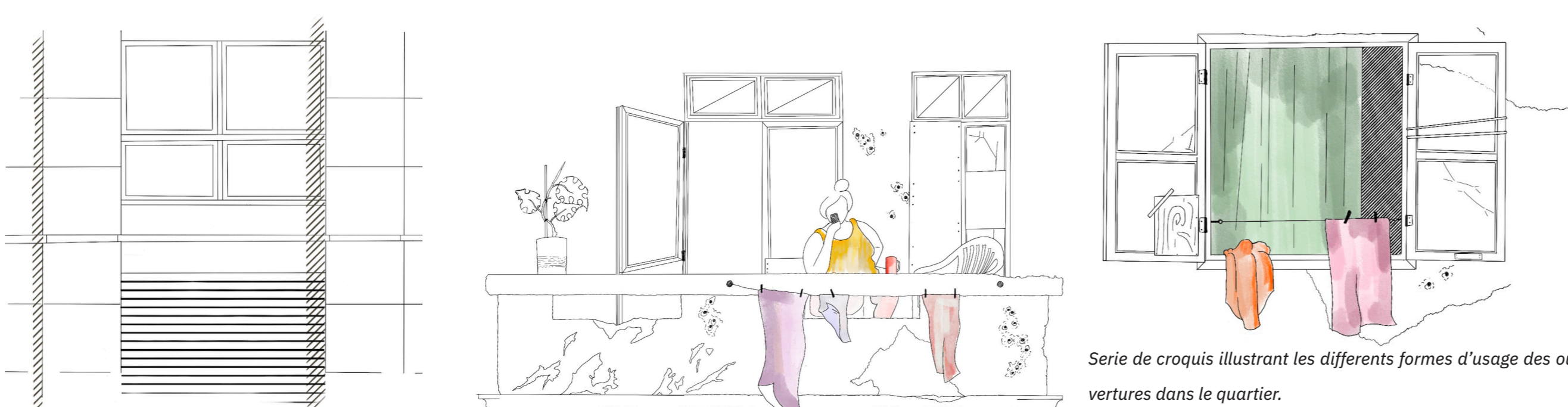
Serie de croquis illustrant les différents formes d'usage des ouvertures dans le quartier.