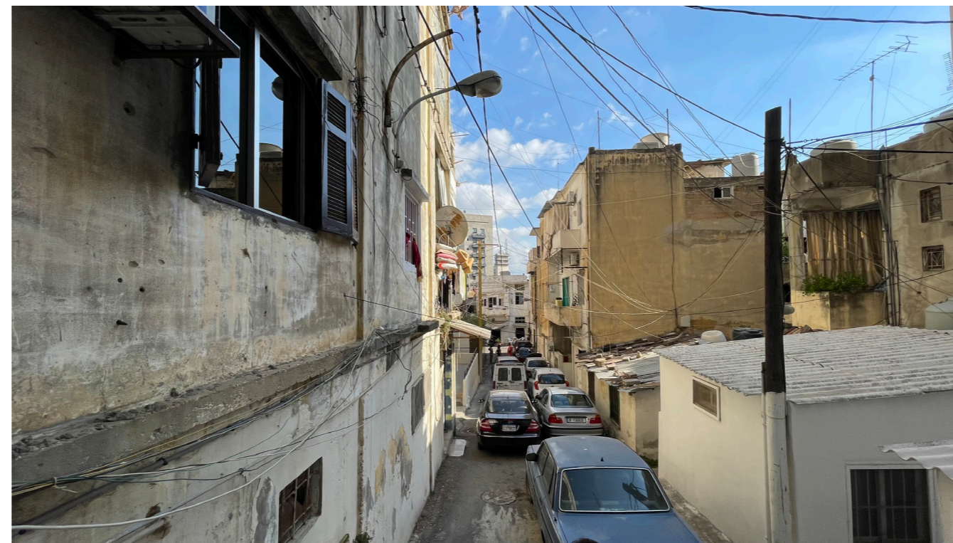
Image illustrant le coeur du quartier Syriac.