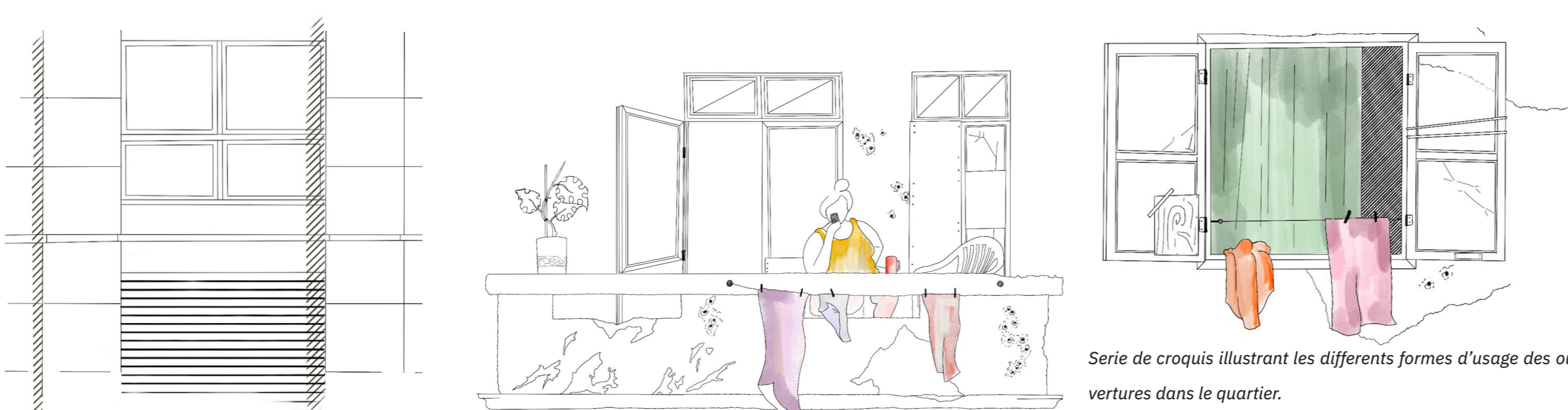
Serie de croquis illustrant les différents formes d'usage des ouvertures dans le quartier.