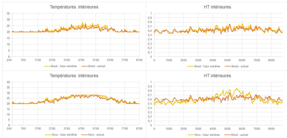
FIGURE 2. Températures et humidités relatives intérieures pour les villes de Nice et Brest

Les ambiances intérieures correspondantes sont calculées à partir des climats extérieurs en suivant la procédure détaillée dans le guide SimHuBat (PACTE, 2021) qui expose la détermination des hypothèses pour la simulation de transferts hygrothermiques dans les parois de bâtiment. Elles sont représentées dans les graphiques de la Figure 2, respectivement pour les villes de Brest et Nice.