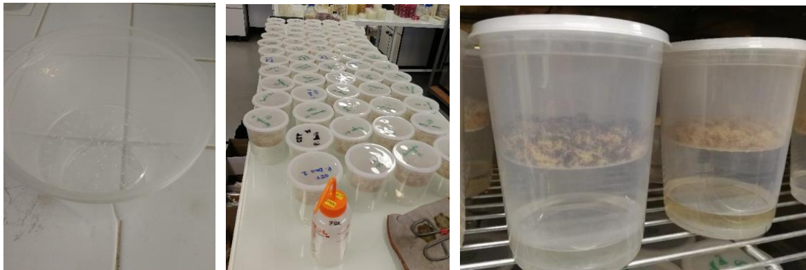
Figure 1. Photos du dispositif

Le spray contenant les souches est formulé avec un mélange d'eau stérile avec 0.01 M/L de MgSO_4 et 0.25 % du tensioactif Twin 20. L'ajout du tensioactif est indispensable pour que les spores hydrophobes ne collent pas aux parois du matériel. Le sulfate de magnésium permet maintenir l'isotonicité de la solution d'extraction. Ce mélange est utilisé pour récupérer les spores sur les boîtes de culture en milieu solide.