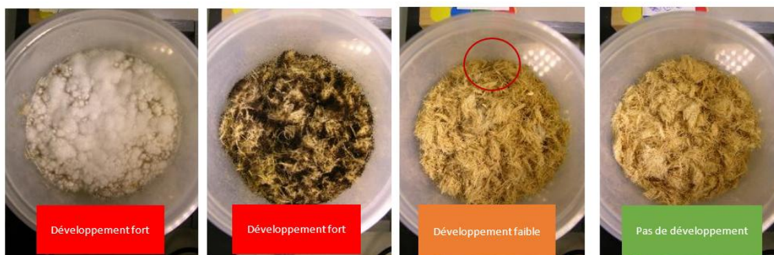
Figure 2. Grille d'évaluation visuelle

Les boîtes fermées sont ensuite conditionnées pendant 28 jours à 25 °C dans une étuve pour la phase d'incubation. La présence d'eau dans le fond de la boîte pendant toute la durée de l'incubation est vérifiée. Au bout de 28 jours, les boîtes sont ouvertes et les fibres sont observées à l'œil et au microscope pour voir s'il y a eu ou non un développement fongique (Fig.2). Chaque boîte est également photographiée avant et après l'incubation.