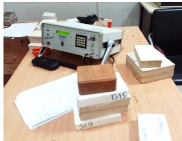
FIGURE 2. Appareil de mesure Ct meter

Les propriétés thermo-physiques des blocs de terre BTS telles que, la conductivité thermique \lambda et la capacité calorifique volumique (VHC), ont été calculées au moyen d'un instrument dynamique (Ct-meter), voir figure 2.