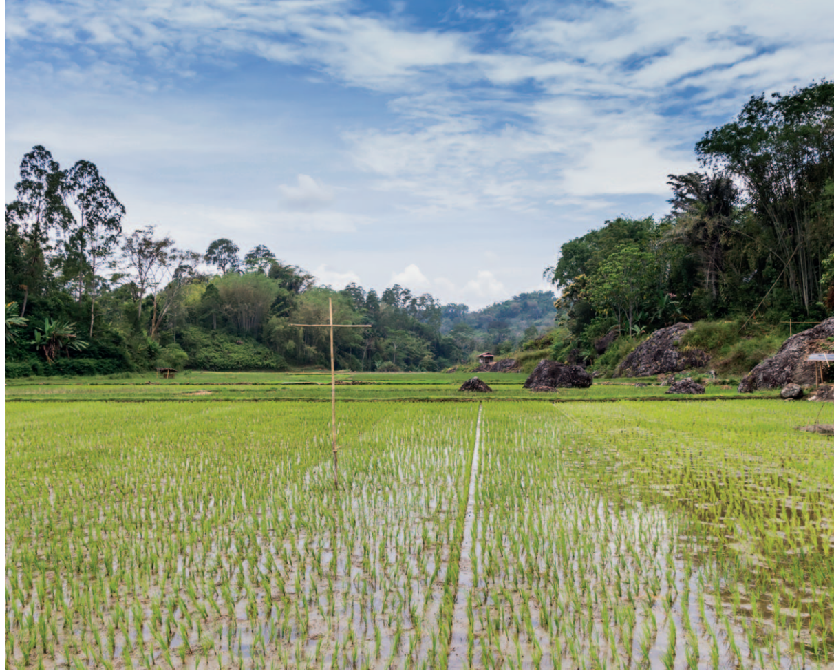
→ Rice Field, île de Sulawesi, Lemo, 2013