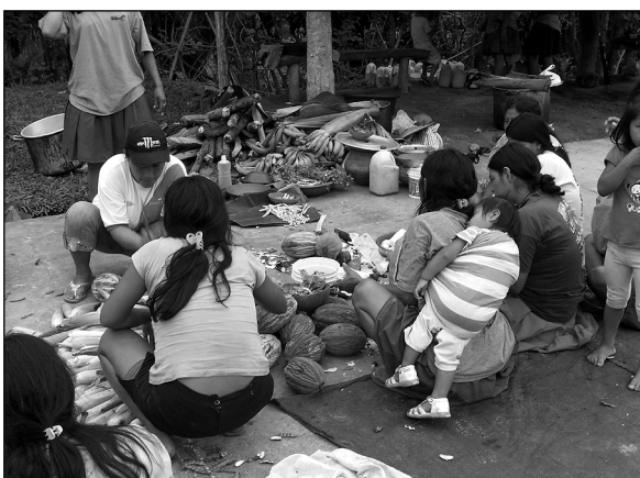
Préparation de plats, Mikuna, Lamas

les femmes s'organisent en groupes inter-générationnels en fonction des plats qu'elles ont décidé de préparer. Elles s'assoient par terre en cercles ou en demi-cercles, préparent les fourneaux, traitent les aliments et discutent entre elles. Les plus âgées apprennent aux plus jeunes les manières de faire. Cependant, les compétences culinaires sont sans cesse renouvelées au sein même des générations : les femmes les plus anciennes n'hésitent pas à échanger leurs points de vue sur les préparations ou à se corriger entre elles, tandis que les jeunes font de même de leur côté. Les observations menées lors de la mikuna