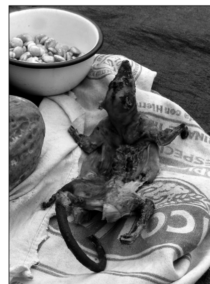
Pericote de monte (Rat des bambous d'Amazonie), Mikuna, Lamas

À même le terrain, plusieurs femmes déploient des bâches sur lesquelles elles posent un grand nombre d'aliments variés en provenance de leurs plantations ou de leurs greniers comme s'il s'agissait de gibier. La plupart de ces aliments m'étaient inconnus, d'autres m'étaient plus familiers en raison de mes voyages précédents en Amazonie. Dans tous les cas, très peu d'entre eux – pratiquement aucun – ne correspondaient aux représentations et images que « la cuisine péruvienne » vise à promouvoir : trop « étranges », encore trop éloignés du restaurant, certains de ses aliments auraient d'ailleurs donné du fil à retordre aux chefs avant-gardistes, spécialistes de la réappropriation et de la « re-signification » d'aliments « exotiques ». Sur les bâches, sont exhibées diverses sortes de légumes, de maïs, de bananes, de poissons de fleuve, de gibier à plumes, d'escargots de terre, de rongeurs de la région ( majaz , añuje , pericote de monte ), de fruits sylvestres et de graines. Le riz, essentiel au régime