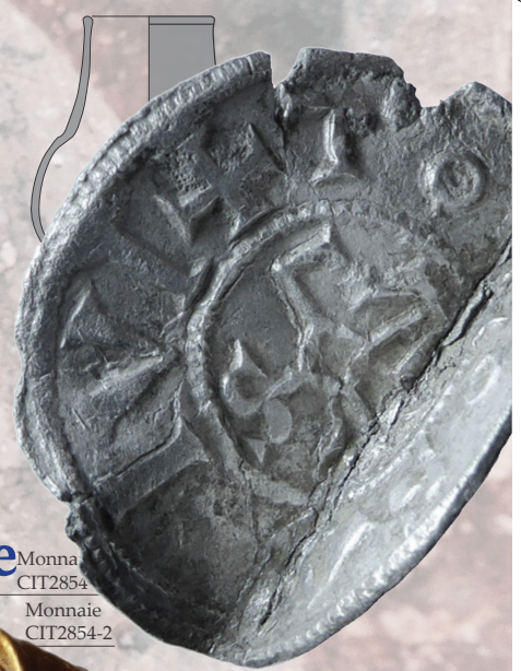
Monnaie CIT2854-5 Monnaie CIT2854-2