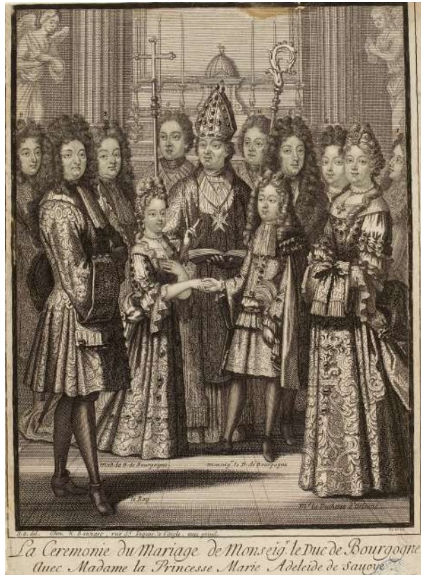
La Cérémonie du Mariage de Monseigneur le Duc de Bourgogne avec Madame la Princesse Marie Adélaïde de Savoie.

D'où Saint-Simon tient-il ses informations ? De la rumeur sans doute, peut-être aussi de son épouse, qui compta parmi les rares dames admises dans le proche entourage de Marie-Adélaïde de Savoie lors du séjour de la Cour à Fontainebleau en 1697 9 . Il ne sait cependant pas tout, puisqu'il ignore le montant de la dot versée pour la couventine de Moret, mais Voltaire, lui, prétend le savoir. Voici ce qu'il écrit dans son Siècle de Louis XIV , pour lequel il avait commencé à assembler de la documentation dès 1728-1729 10 :