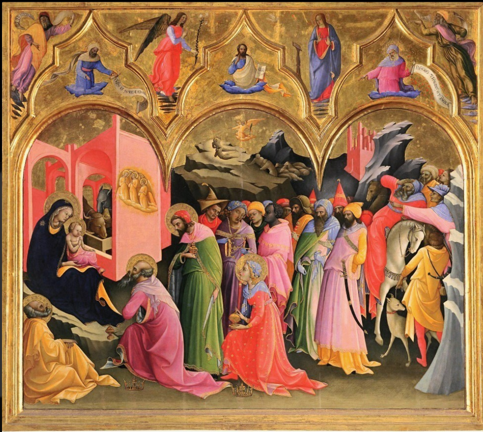
Lorenzo Monaco, Adoration des mages , 1421 – 1422, tempera et or sur bois, 144 x 177 cm, Florence, Musée des Offices.