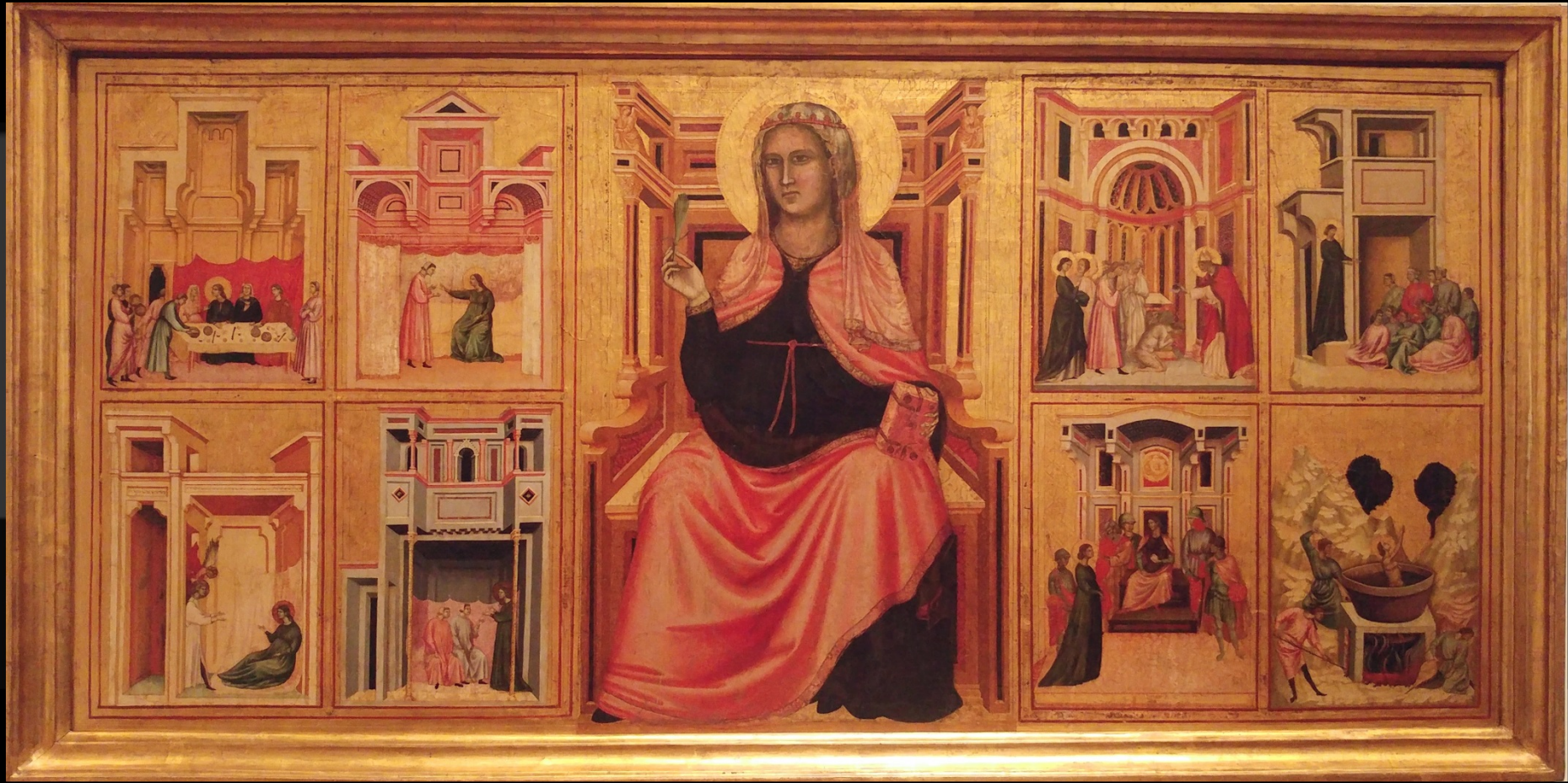
Maître du retable sainte Cécile, Scènes de la vie de sainte Cécile , 1300 – 1310, tempera et or sur bois, 85 x 1811 cm, Florence, Musée des Offices, photo personnelle.