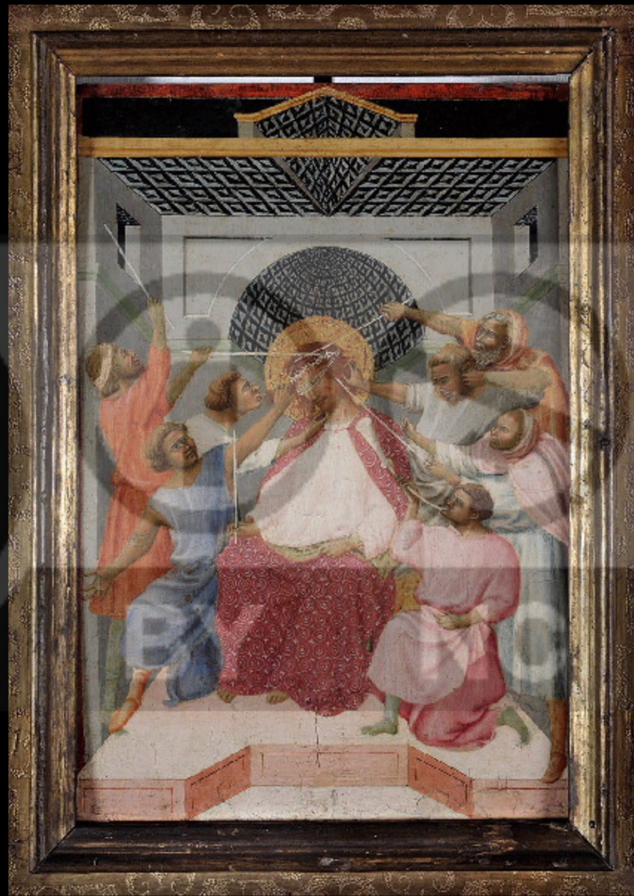
Lippo di Benivieni, Le Christ aux outrages , c. 1330, tempera et or sur bois, 26 x 37,5 cm, Strasbourg, Musée des Beaux-Arts.