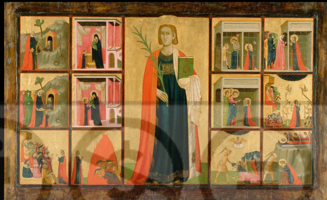
Donato et Gregorio d'Arezzo, Scènes de la vie de Catherine d'Alexandrie , c. 1330, tempera et or sur bois, 107 x 174 cm, Los Angeles, Getty Museum.