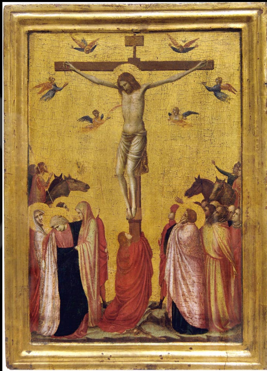
Giotto, Crucifixion , 1319 – 1320, tempera et or sur bois, 45 x 33cm, Strasbourg, Musée des Beaux-Arts.