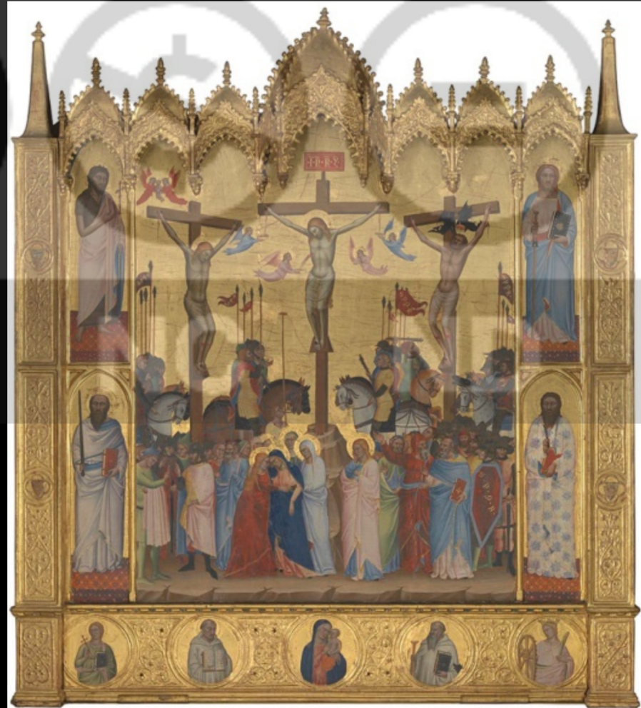
Jacopo di Cione, Crucifixion , 1369 – 1370, tempera et or sur bois, 154 x 138,5 cm, Londres, National Gallery.