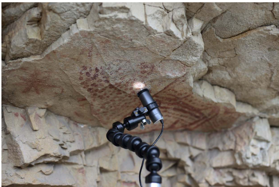
Fig. 3 – Observation mésoscopique de la paroi à l'aide d'un microscope numérique