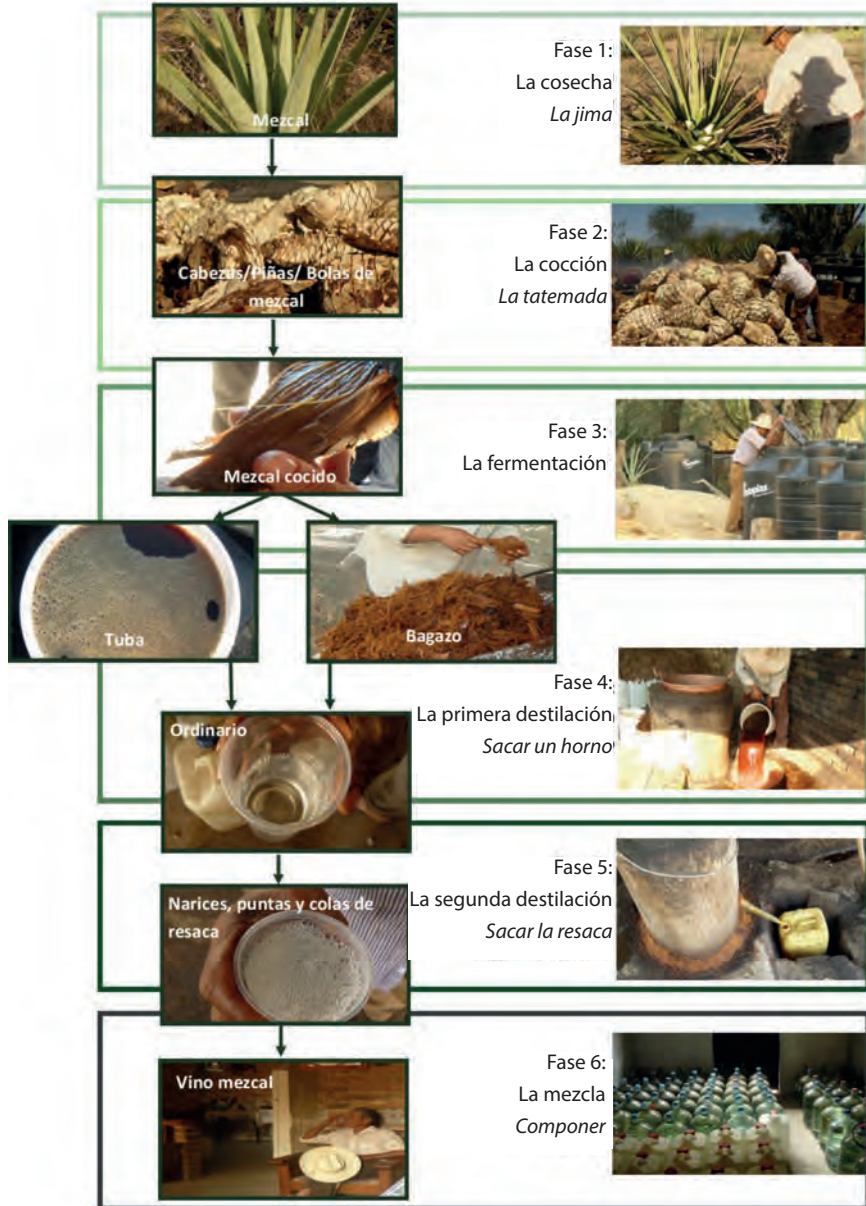
Figura 3 Cadena técnica de transformación del agave en vino mezcal en Zapotitlán de Vadillo, Jalisco