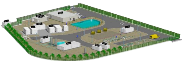
Figure 1 - Schéma de l'installation Jupiter1000

Jupiter 1000 [11] dispose d'une unité de production d'hydrogène, d'une puissance totale de 1 MW, constituée d'un électrolyseur alcalin et d'un électrolyseur PEM de 0,5 MW chacun, avec un débit d'hydrogène produit de l'ordre de 200 Nm 3 /h. L'installation comprend également une unité de traitement de l'H 2 produit, un compresseur permettant de stocker l'hydrogène à 200 bar et un poste de mélange de l'hydrogène avec le gaz naturel pour l'injection du gaz mélangé, conforme aux spécifications réglementaires applicables au gaz naturel, dans le réseau de GRTgaz.