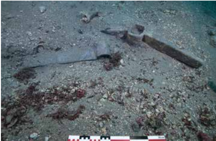
Figure 7. Les jas d'ancre E et F in situ. Échelle 50 cm. (L. Damelet, CNRS/CCJ).

La plupart des ancres se présentent selon un groupement chaotique, bien que toutes soient proches de l'extrémité ouest de l'épave. En revanche, l'ancre A semble encore se trouver dans sa position de stockage, avec la verge parallèle à l'axe longitudinal du navire et les bras pointant vers l'ouest. Quoi qu'il en soit, la position de ces équipements nous permet de restituer avec certitude la direction de marche du navire puisque, en règle générale, les ancres sont entreposées à l'avant du navire. Ceci confirme l'hypothèse d'une cuisine et d'un espace de vie situés à l'avant.