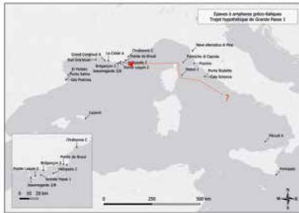
Figure 6. Restitution de la route empruntée par le navire Grande Passe 1 (A. Sabastia, Inrap/CCJ).