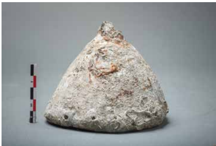
Figure 4. Le plomb de sonde. Échelle 5 cm.