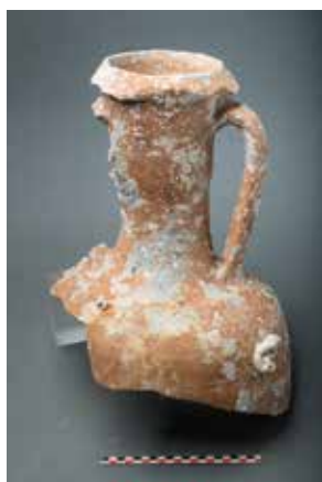
Figure 5. Partie supérieure d'une amphore gréco-italique découverte en 2017. Échelle 20 cm.

La cargaison du navire a probablement été pillée dès la découverte de l'épave, dans les années 1970 (Long, 2004 : 74). Les recherches récentes ont néanmoins livré trois amphores gréco-italiques complètes ou brisées qui ont échappé au pillage (Fig. 5).