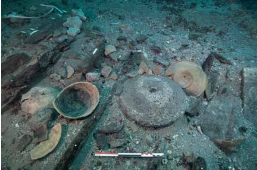
Figure 3. La cambuse en cours de fouille. Echelle 30 cm.

l'extrémité ouest de l'épave Grande Passe 1 correspond à l'avant du navire. On verra plus loin que la position des appareils vient confirmer cette hypothèse.