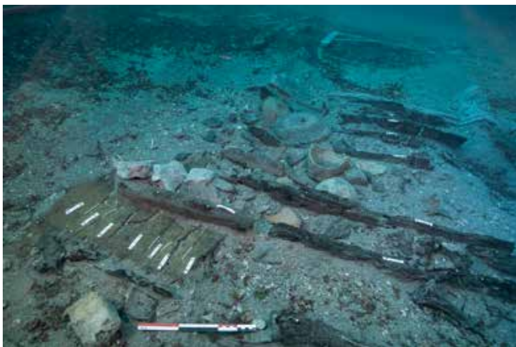
Figure 8. Vue de la zone avant de l'épave, avec le fond de coque conservé. Échelle 30 cm (L. Damelet, CNRS/CCJ).

pour cette pièce de la charpente. En revanche, le brion d'étrave est en chêne caducifolié ( Quercus sp.), un bois noble bien adapté à un usage pour la charpente axiale (Guibal et Pomey, 1998 : 432). L'essence du brion d'étambot n'a pas encore été déterminée, mais son aspect laisse penser qu'il a été également fabriqué dans du chêne.