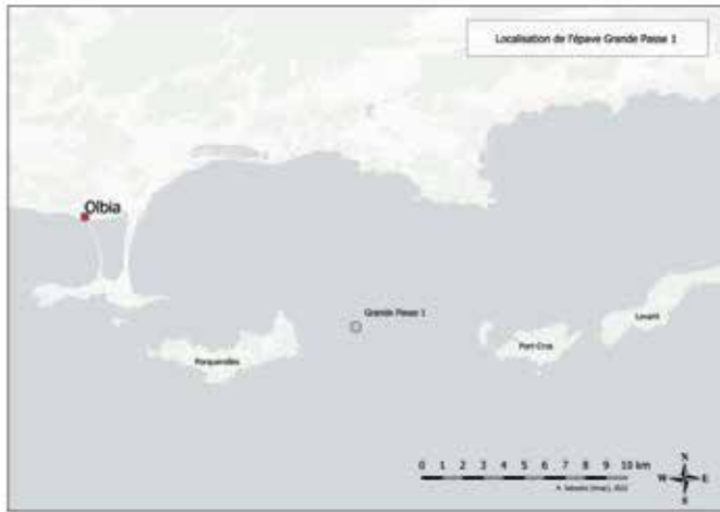
Figure 1. Localisation de l'épave au large de Porquerolles (A. Sabastia).