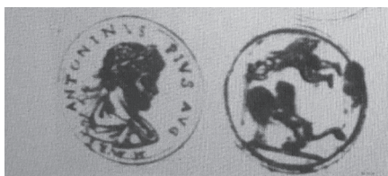
Fig. 8 Disegno autografo di P. Ligorio di una moneta con venatio Napoli, BN, ms. XIII.B.6 f. 256r (da Tomasi Velli 1990, tav. XLVIII.2).