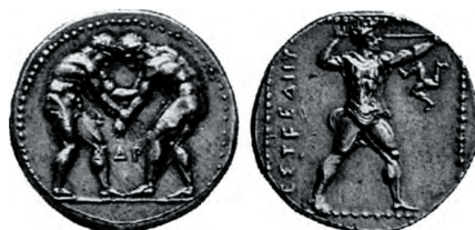
Fig. 12 Statere d'argento di Aspendos, 410 a. C. (Parigi, Cabinet des médailles, inv. 99).