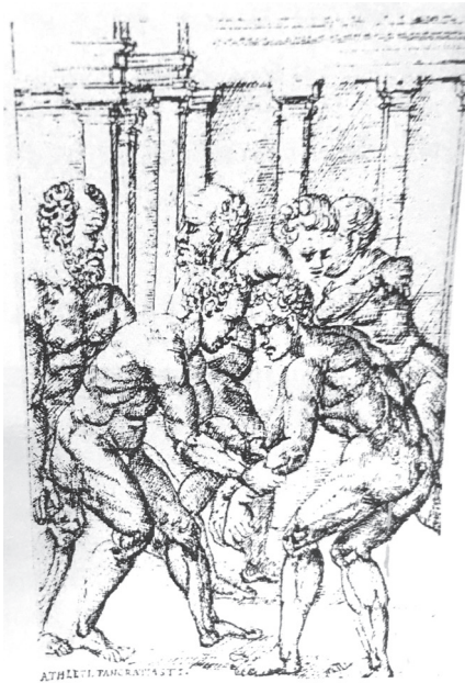
Fig. 10.2 G. Mercuriale, De arte gymnastica , 1573 (da Vagenheim 2008a, 142, fig. 7a).