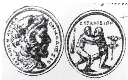
Fig. 11 Pirro Ligorio, Antichità romane , Napoli, BNNa, cod. XIII.B1, f. 348v. Moneta sicuracusana di Ercole in lotta con Anteo (da Vagenheim 2008a, 142, fig. 7c.).

del circo (fig. 9), furono utilizzati per illustrare il libro sulla ginnastica antica di Mercuriale 21 i cui disegni preparatori sono conservati nell'archivio di Stresa 22 ; essi, come i lottatori, si ritrovano nei soffitti della Sala dei Giochi, sempre privi di mutande (fig. 13). I cesti pubblicati nel libro di Mercuriale sono ugualmente tratti dalle Antichità romane ; nel passo dedicato alla loro scoperta in «antiche sepolture, monete di rame o in pili», e alla loro descrizione con «fortissimo cuoio bovino o lamine di piombo con palle plumbee attaccate», Ligorio si sfoga, probabilmente contro Mercuriale. Il forte rammarico di Ligorio per i furti dei suoi disegni sui giochi romani commessi da Panvinio nella stesura dei libri De ludis circensibus (1600), nonchè da altri 'amici' come Mercuriale, che riprese i disegni dei cesti che Ligorio aveva visto in uno scavo a Roma 23 , fu compensato dalla pubblicità che ne trassero le sue invenzioni attraverso la stampa delle opere degli eruditi sopracitati, nel servire da modello a diverse altre traduzioni artistiche (affreschi di Sabbioneta e del Castello Estense). I libri De Ludis circensibus e De arte gymnastica assicurarono a Ligorio il primato nel campo delle ricerche antiquarie sull'agonistica antica nella seconda metà de Cinquecento.