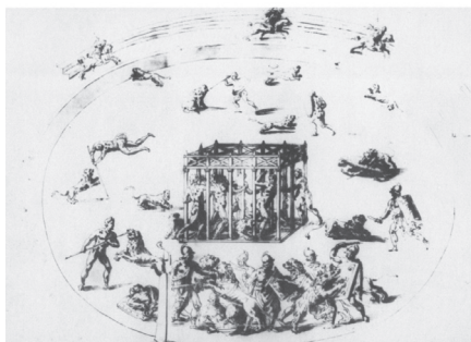
Fig. 7 Copia da Ligorio eseguita da Onofrio Panvinio nel Codex Ursinianus , fol. 53, Biblioteca Apostolica Vaticana (= Vat.lat. 3439).

È chiaro che le incisioni non furono eseguite sui maldestri disegni di Panvinio visibili nel codice Orsiniano 12 , bensì sulle più elaborate riproduzioni di Ligorio, oggi perdute, probabilmente durante il processo di incisione.