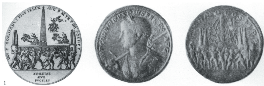
Fig. 9 Conio di Giordano nel De Ludis circen- sibus (da Tomasi Velli 1990, tav. XXXVIII, 1).

Tuttavia, per fortuna, non tutti i disegni di Ligorio sono andati perduti. Lo possiamo verificare precisamente nel caso dei lottatori e pugili che ornano il frontespizio superiore della pubblicazione di Panvinio sui circhi. La loro iconografia è tratta, con la solita maestranza ligoriana, da una moneta di Gordiano che Panvinio riprodurrà nel libro sui circhi (fig. 9); essi appaiono anche in una serie di disegni ligoriani le cui copie sono conservate nell'archivio Borromeo di Stresa (fig. 10, 1); questi disegni erano destinati ad illustrare la seconda edizione (1573) dei libri De arte gymnastica di Girolamo Mercuriale (fig. 10, 2). Come per le scene di naumachia e di venatio rappresentate nei cartigli inferiori, l'iconografia dei lottatori è tratta da monete, quasi sempre autentiche, che Ligorio aveva disegnato nei volumi delle sue Antichità romane , fondate sulle fonti numismatiche 13 ; nel caso specifico, l'antiquario la identifica con una moneta siracusana che tuttavia non ho potuto rintracciare (fig. 11), mentre ritroviamo una corrispondenza quasi perfetta con i lottatori ligoriani in uno statere di Aspendos (fig. 12), secondo una proposta di Jean-Michel Agasse 14 .