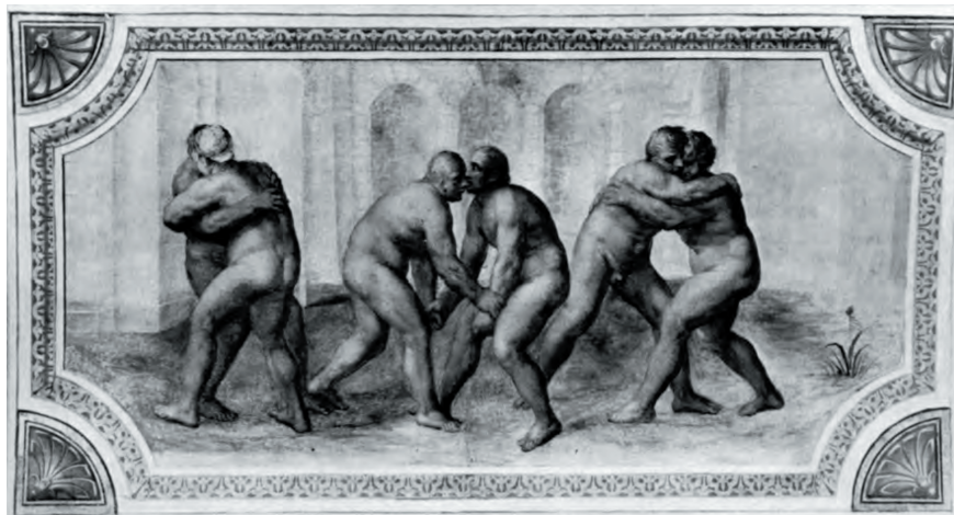
Fig. 13 Pirro Ligorio, La lotta , Ferrara, Castello Estense, Salone dei Giochi (eseguito da Sebastiano Filippi detto il Bastianino, 1574).