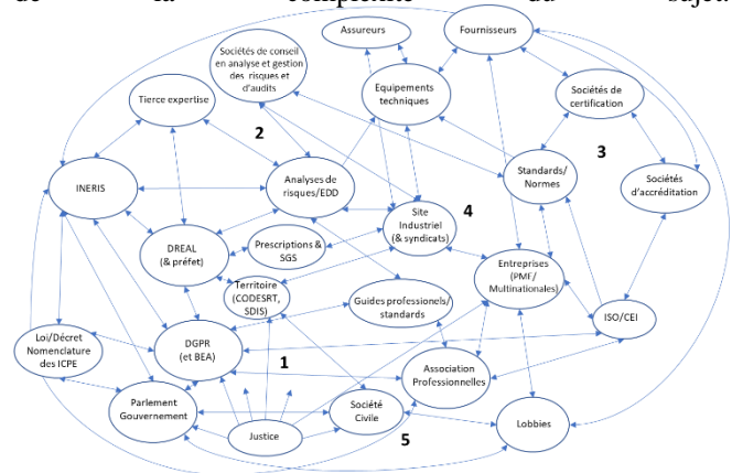
Figure 1. IOR-RRGR des ICPE

d'enquêtes empiriques [7] permet de fournir un point de vue sur les IOR-RRGR en identifiant des artefacts, instruments, acteurs, organisations ou institutions (figure 1). Même si sur le plan des connaissances il existe de très grandes zones d'ombres sur toutes ces interactions d'un point de vue empirique, ce passage par la visualisation, sans grande élaboration théorique, permet une vue d'ensemble témoignant de la complexité du sujet.