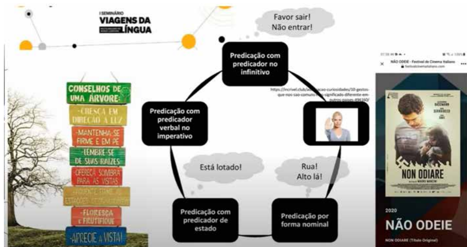
Figura 1: Exemplos oriundos de diferentes padrões construcionais de predicação.