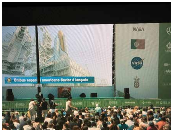
Figura 2: foto e trecho do texto intitulado “Portugal, a SIC, a Sagres e o Continente aparecem em ‘Não Olhem para cima’” em que há comentário sobre a foto. 7

A imagem do momento em que Portugal assiste à missão