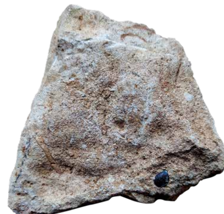
Bloc de calcaire à plantes du tumulus contenant deux dents de poisson pycnodonte (un seul visible sur la photographie).

Quisque in est eu est tincidunt consectetur. Nulla volutpat mattis blandit. Sed rhoncus justo at efficitur semper.