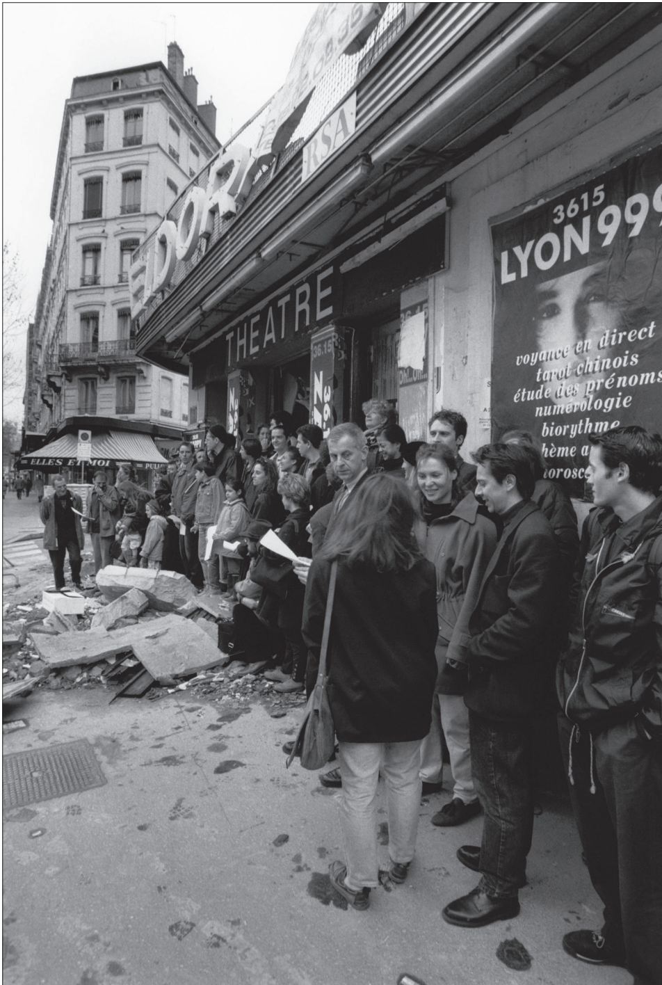
SIT-IN DU COLLECTIF ELDORADO THÉÂTRE L'ELDORADO LYON, 24 MARS 1993