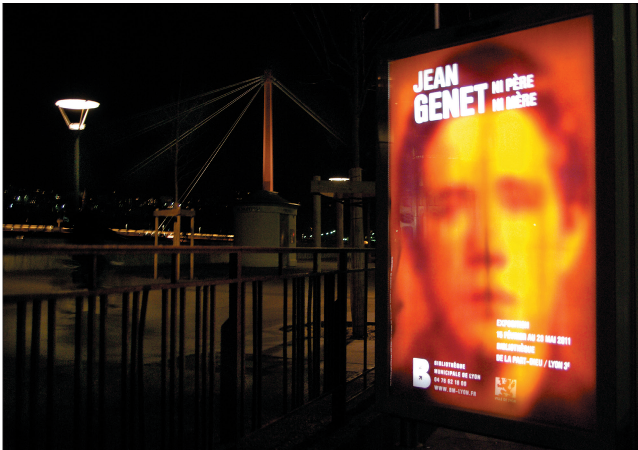
"GENET NI PÈRE NI MÈRE" EXPOSITION BIBLIOTHÈQUE MUNICIPALE LYON, 15 FÉVRIER-28 MAI 2011