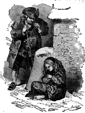
Illustration de Bertall, Hachette, 1862.