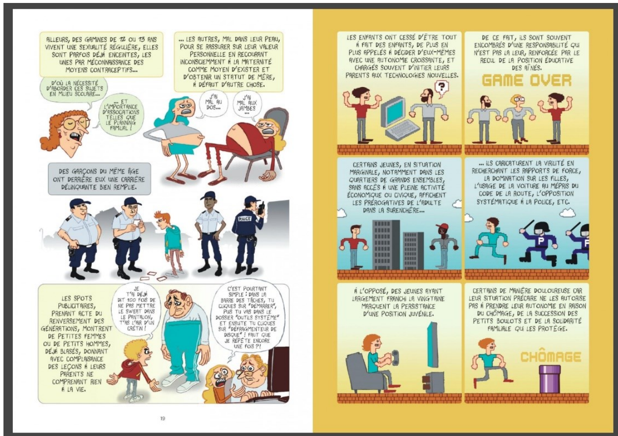
Pochep et Le Breton (19-20)

dessinateur s'unissent pour nous faire comprendre le monde, en bande dessinée ! [...] Ces bandes dessinées ne sont donc pas construites comme des récits de fiction, mais comme des approches sérieuses, vulgarisées et ludiques » 9 . Dans les faits, les collaborations vont de la discussion constante et détaillée au fil de la création à l'adaptation d'un texte brut, même s'il y a toujours des échanges. Les chercheurs sont rarement des praticiens de la bande dessinée et s'appuient donc sur des auteurs recrutés pour vulgariser leurs travaux, avec l'idée un peu naïve qu'une BD est toujours plus simple à comprendre et que n'importe quel dessinateur sera à l'aise avec ce travail. L'exercice est en réalité tout sauf évident.