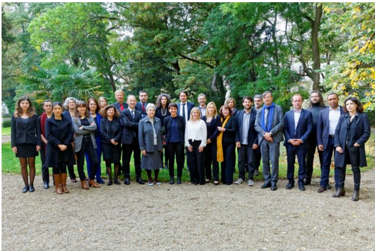
Éducation nationale | Enseignement supérieur et recherche | Publié le 18 octobre 2016