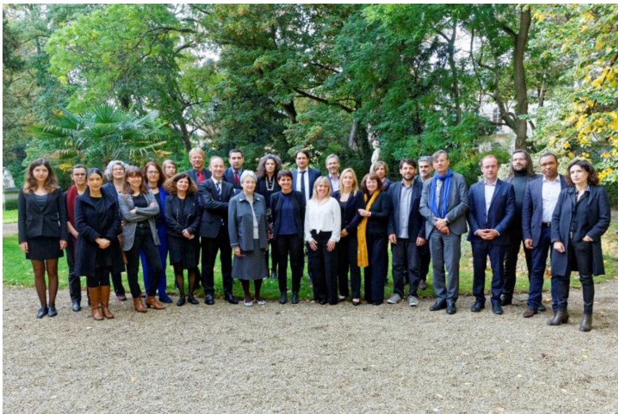
Education nationale | Enseignement supérieur et recherche | Publié le 18 octobre 2016