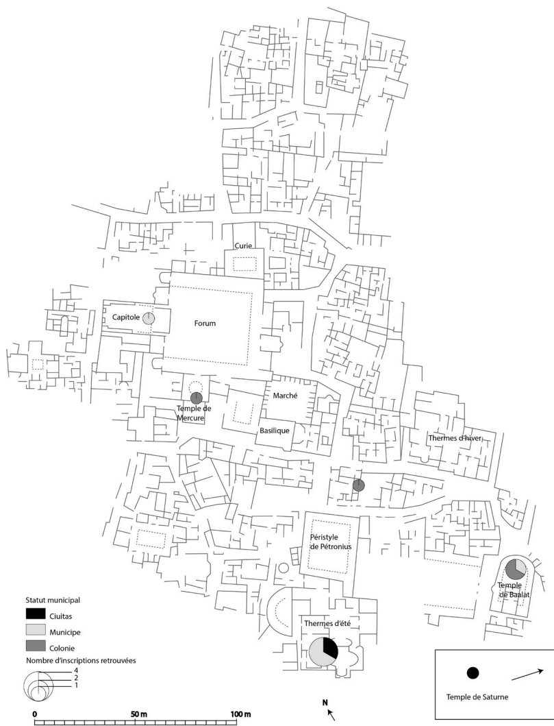
Fig. 2. Carte de répartition des inscriptions mentionnant le statut institutionnel de Thuburbo Maius . À partir du plan de Thuburbo Maius publié dans MCDavid 2019, p. 5, fig. 3 (German Archaeological Institute).