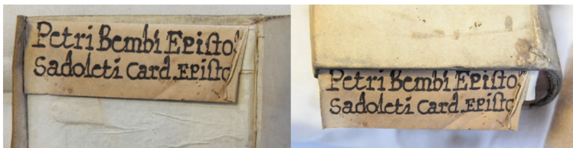
Fig. 7. Titre supplémentaire ajouté sous forme repliée.

Source/Crédit : bibliothèque du Centre culturel irlandais, Paris, cote B 1118. Photo M. Walsby