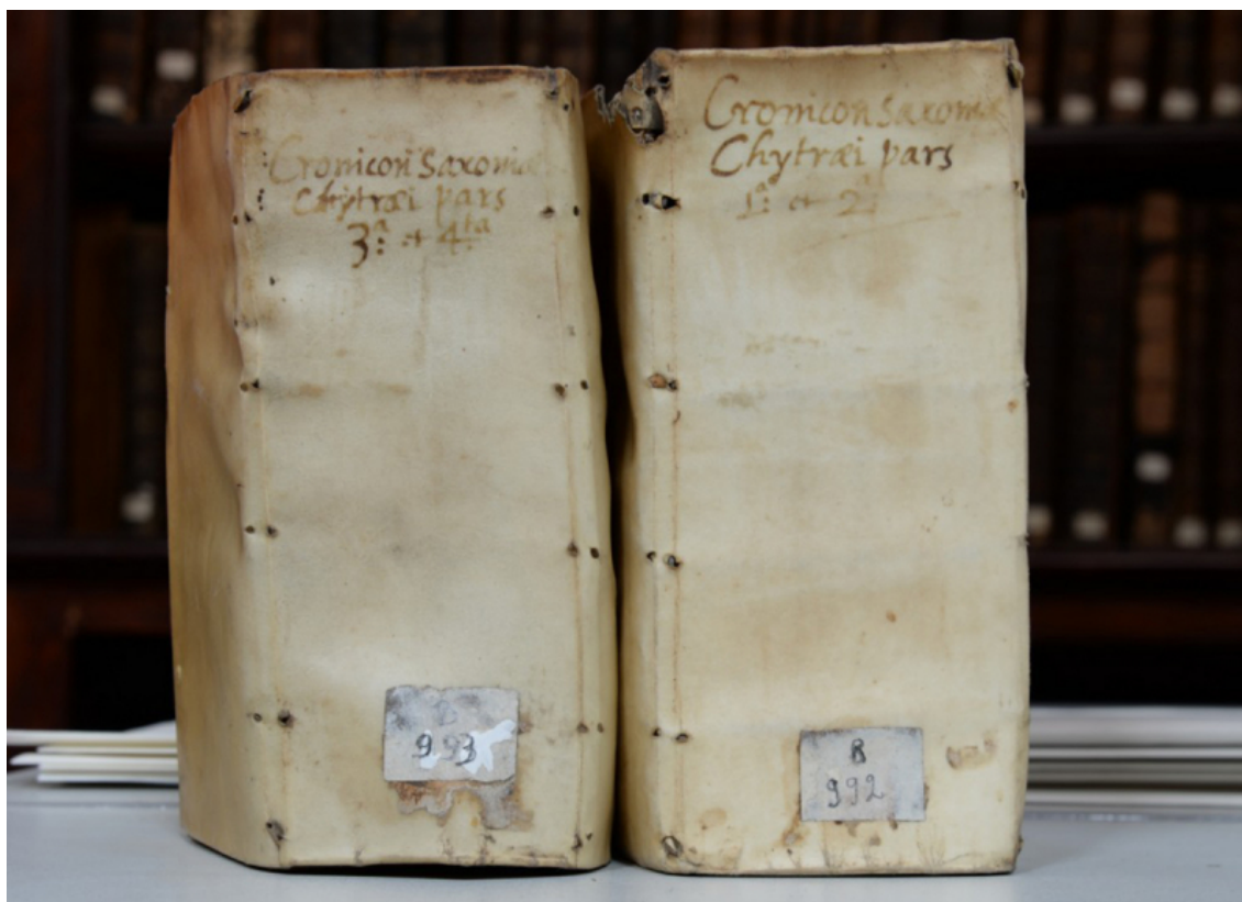
Fig. 4. Reliures des volumes B 992 et B 993.