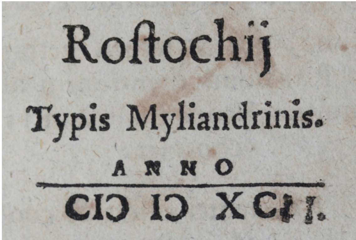
Fig. 3. Date modifiée a posteriori de l'édition de Rostock du Chronicon Saxoniae de David Chyträus.