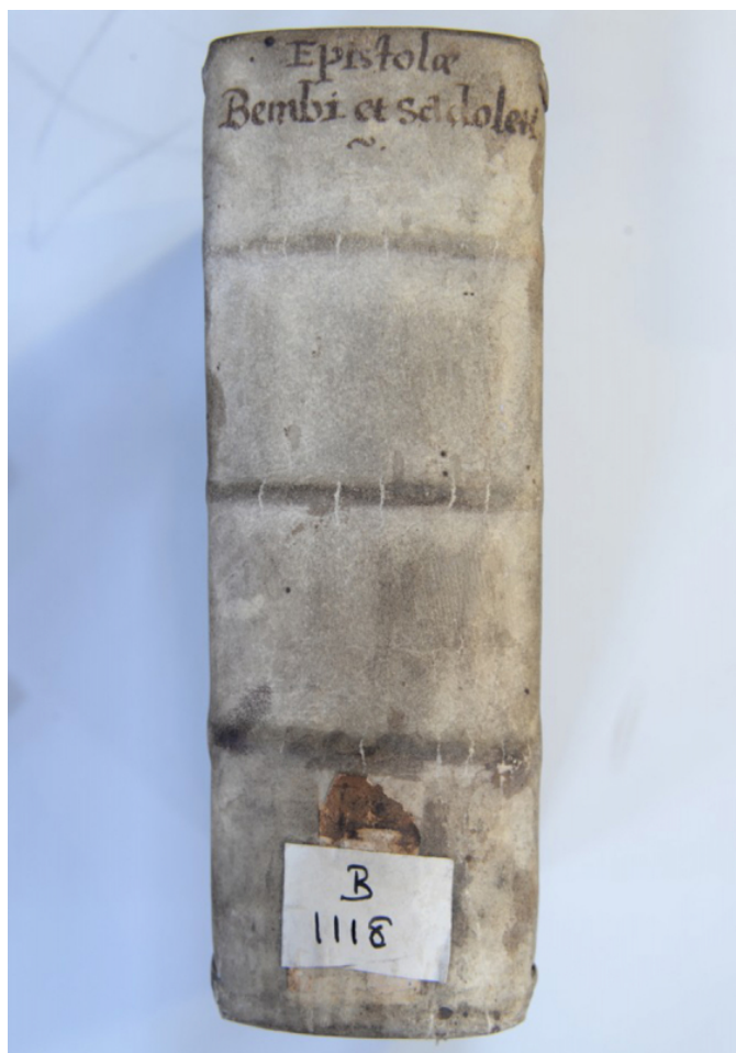
Fig. 6. Dos du recueil des lettres de Bembo et Sadoletto.