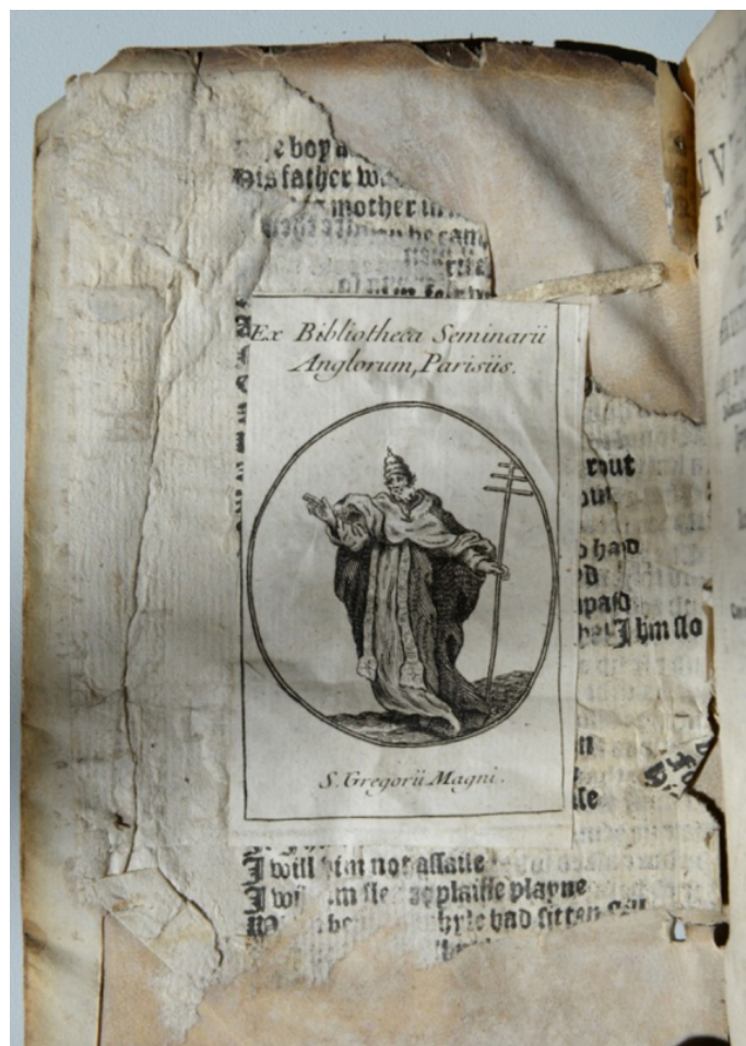
Fig. 1. Ex-libris gravé du collège des Anglais de Paris.