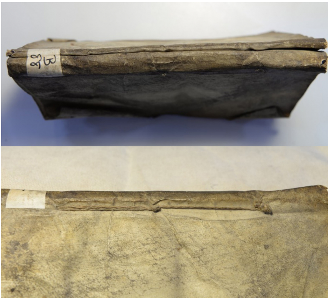
Fig. 2. Recueil de deux œuvres de Jules-César Boulenger.