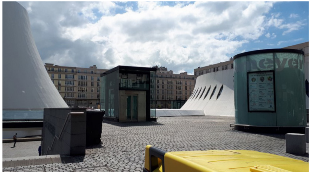
Fig. 7 : Objets, sas de sortie, édicules, bouchent les perspectives. Dominique Dehais, 2019.