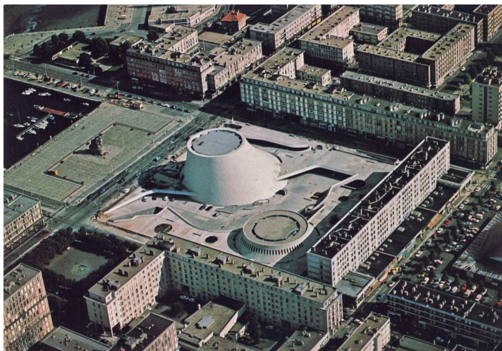
Fig. 4 : L'Espace Niemeyer et son environnement, vers 1980