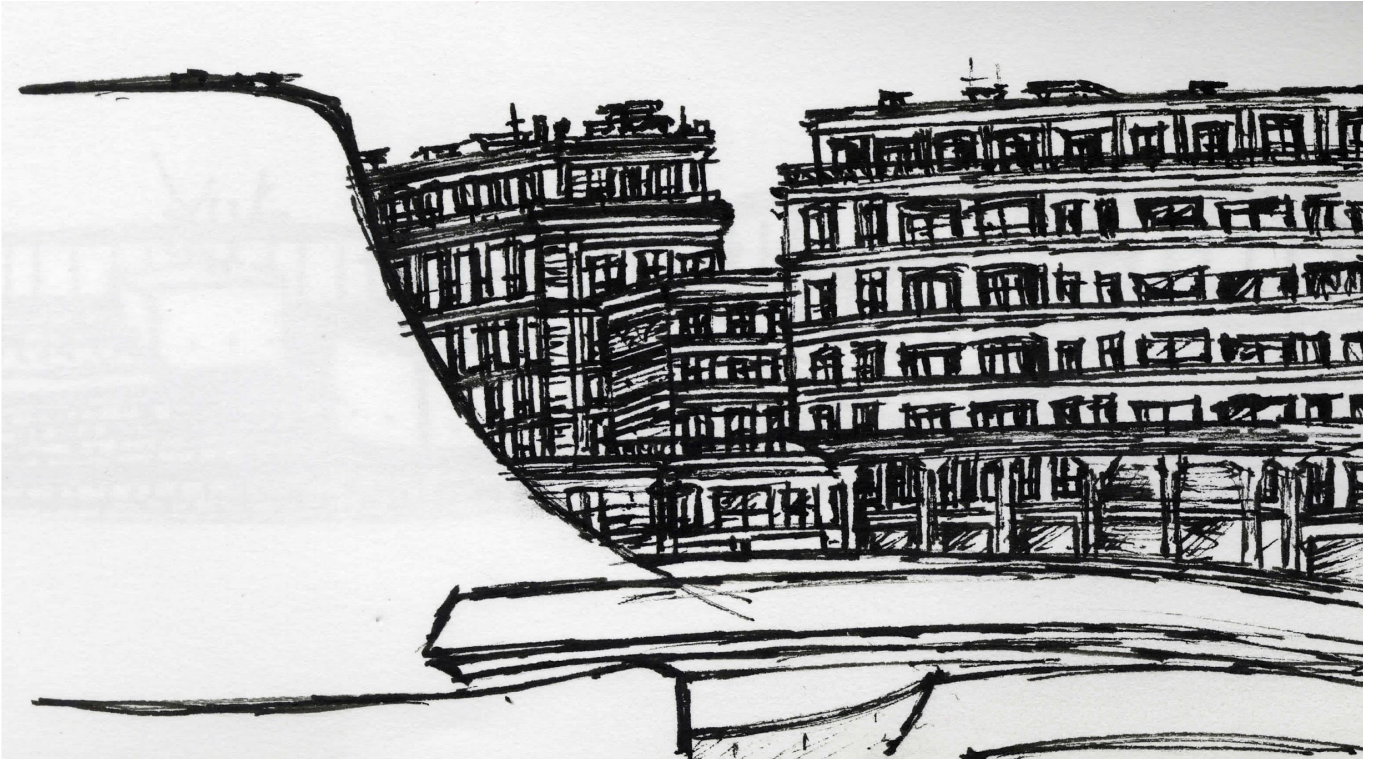
Fig. 1 : Contraste entre le Volcan et les immeubles de Perret. Croquis © Gaël Gunay Akkoc, 2019.