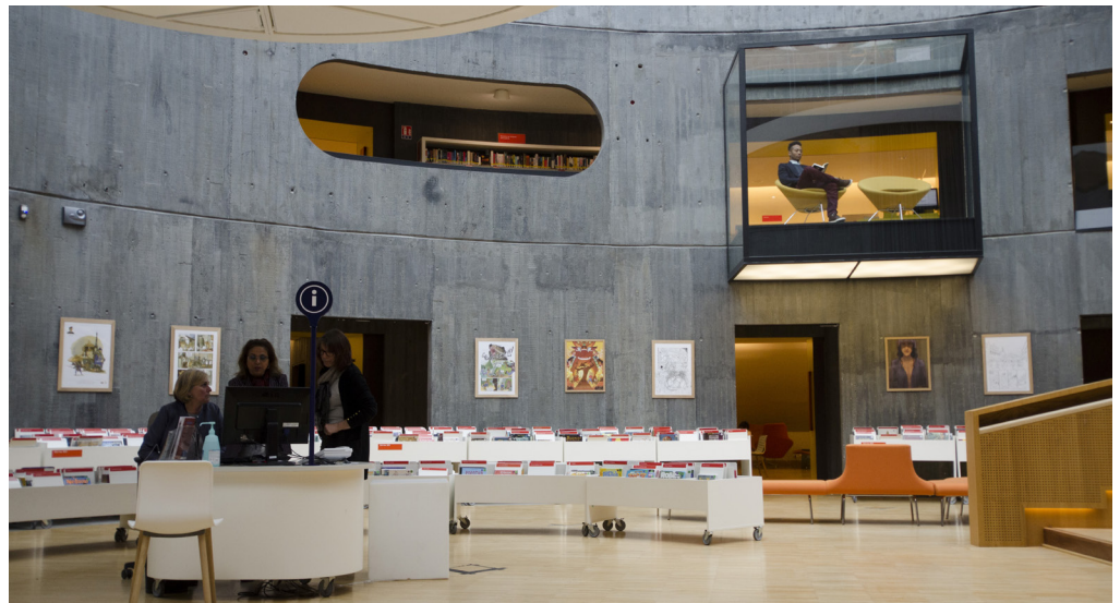
Fig. 2 : Le poste de travail dans l'atrium. © Dominique Dehais, 2019.