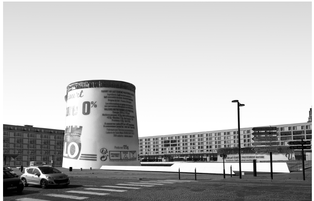
Fig.8 : Montage réalisé par Mathis Hédouin-Leroux, janvier 2020

Pour poursuivre un débat qui sans doute ne cessera pas de sitôt – des avis contradictoires, incompatibles ou divergents s'affrontent également lors des reconfigurations de places de grandes métropoles et lors de la création de Zones d'Aménagement Concertées – et sans fournir de réponse définitive, mentionnons que de nombreux Havrais et Havraises, croisés au cours de nos visites sur le site et ses abords, semblent apprécier cet espace de nouveau accessible, pour se rendre à des spectacles dans le Grand Volcan après une dispersion de sa scène artistique au cours des années précédentes et pour profiter d'une bibliothèque en centre-ville.