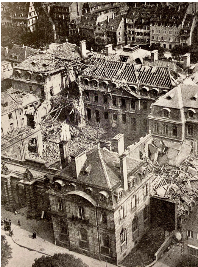
Fig. 1 : Le musée de l'Œuvre Notre-Dame à Strasbourg après le bombardement du 11 août 1944. HAUG, Hans, « La réouverture à Strasbourg du musée de l'Œuvre Notre-Dame », Bulletin des musées de France , n°6-7, 1946, p. 59.