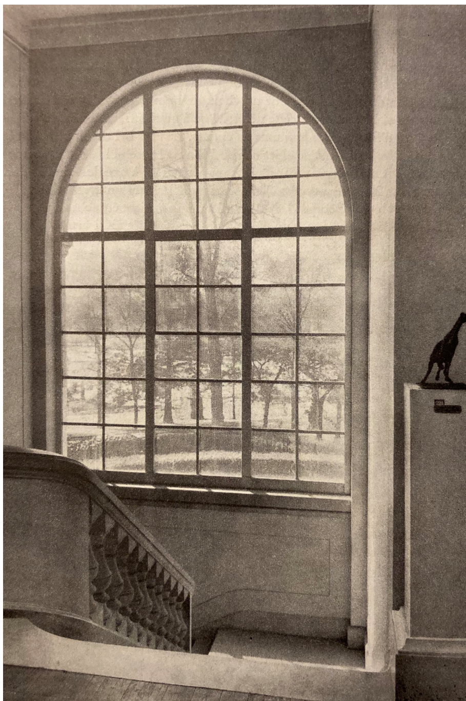
Fig. 3 : Vue du jardin des Tuileries depuis le musée de l'Impressionnisme, Paris. BAZIN, Germain, « Une expérience : le musée de l'Impressionnisme », Museum , n°1-2, 1948, p. 42.