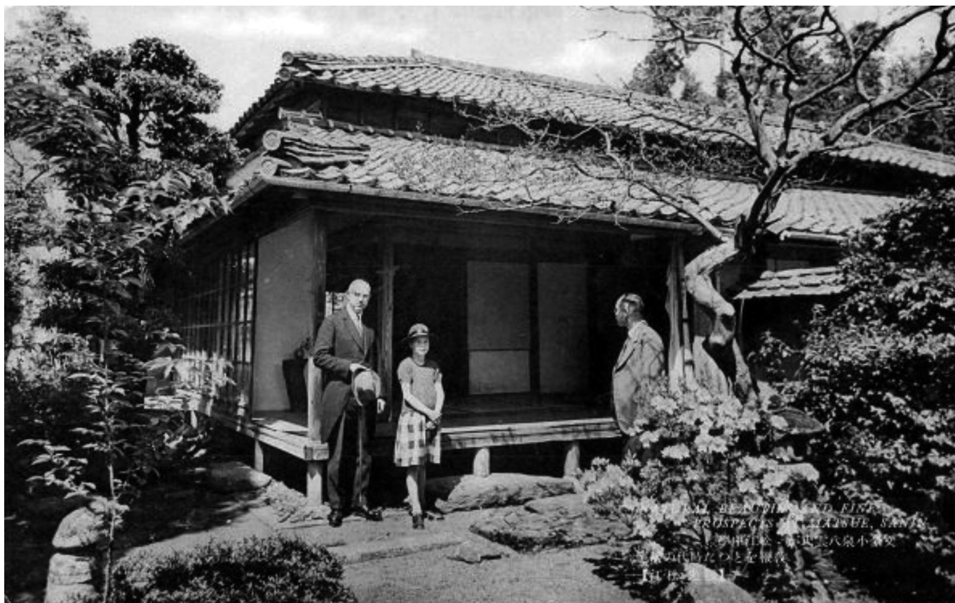
Fig. 3 : Carte postale du début du XX e siècle représentant l'ancienne demeure de Lafcadio Hearn à Matsue.