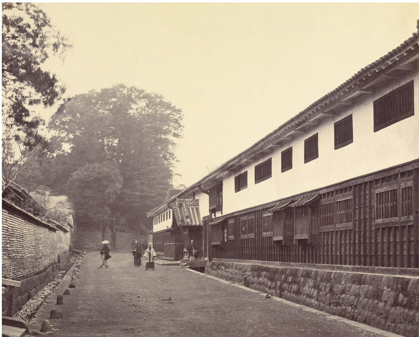
Fig. 4 : Photographie du nagaya du palais du seigneur Arima à Edo, Felice Beato, 1867. @ J. Paul Getty Museum