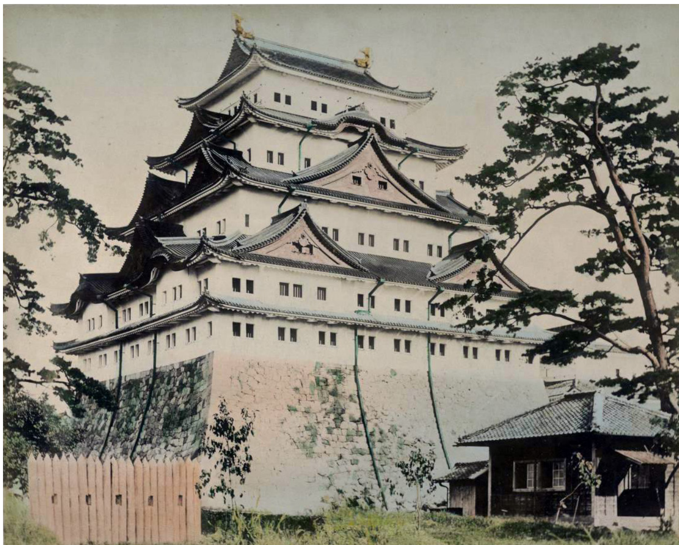
Fig. 5 : Photographie du château de Nagoya