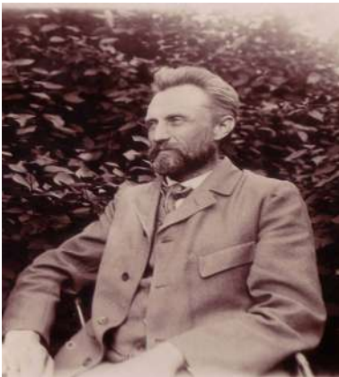
(a) Jan Ptaszycki w ogrodzie

Litograficzne wydania wykładów Ptaszyckiego w latach 1896–1909 dotyczyły geometrii analitycznej [P14], [P15], [P19], [P20], [P23], [P26], zastosowania rachunku całkowego w geometrii [P22], [P24] i funkcji eliptycznych [P25].