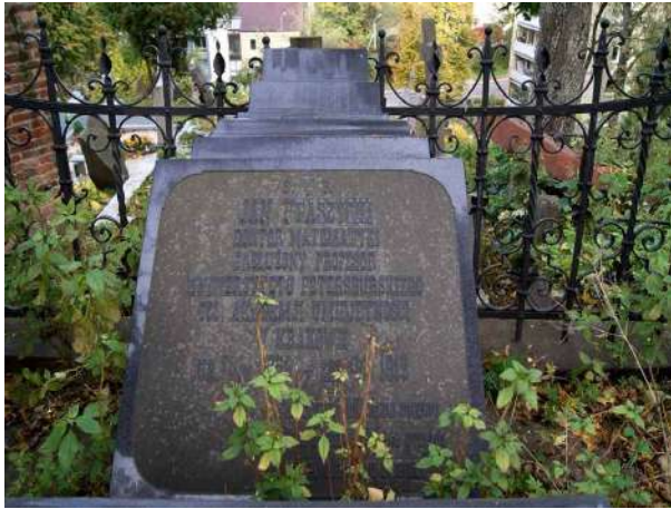
6: Nagrobek Jana Ptaszyckiego w Wilnie

Szcątki Ptaszyckiego zostały złożone na cmentarzu Antokolskim w Wilnie przy kościele św. Piotra i Pawła, gdzie są też groby jego rodziny. Napis jaki się znajduje na nagrobku: