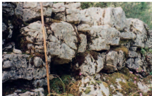
Fig. 11 — Fortification de Lavdani.