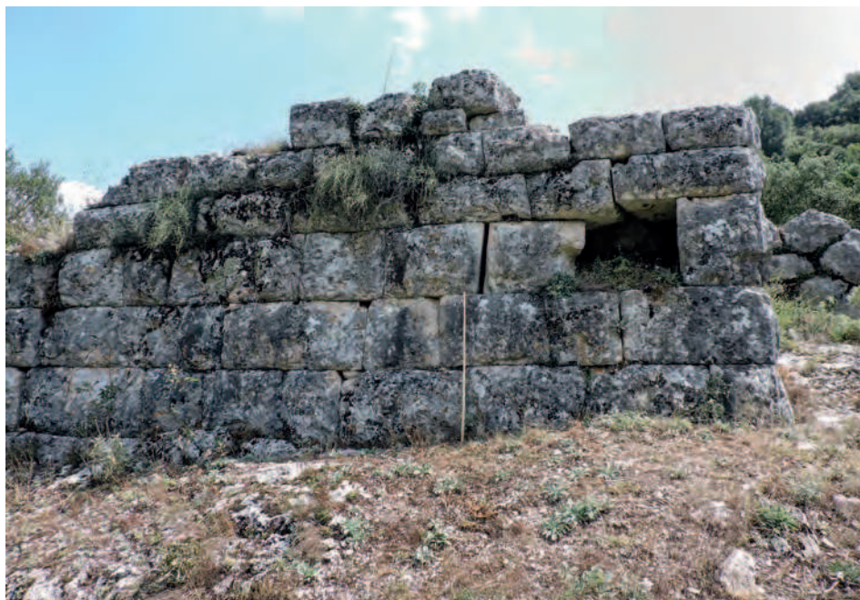
Fig. 5 — Tour méridionale de Kalendji.

manquent. Revenons sur deux moments importants mais problématiques de l'histoire épirote.