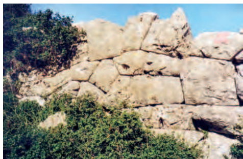
Fig. 8 — Fortification de Léromnimi (cl. M.-P. Dausse).