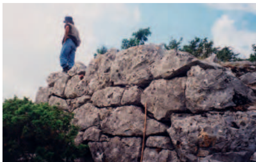
Fig. 10 — Fortification de Houliarades.

entre économie pastorale et ouvrages fortifiés pourrait ouvrir de riches perspectives. Prometteuses mais très complexes.