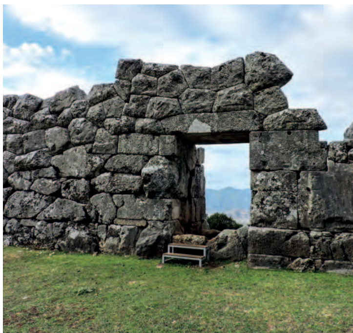
Fig. 4 — Fortification d'Éléa, porte orientale.

que trois portes (fig. 4). Puis, dans la seconde moitié du IV e s. et au III e s., alors que l'urbanisation se développe, les fortifications des villes deviennent plus complexes : multiplication des tours – régulièrement réparties pour les créations nouvelles 28 –, entrées plus nombreuses pour faciliter les accès depuis l'extérieur 29 , définition de différents types d'espaces à l'intérieur grâce à des diateichisma comme à Gitana 30 . Peu à peu, il semble ainsi possible de différencier ces grandes villes des centres secondaires, centres de petits ethnè (fig. 5) 31 . Toutefois, en dehors de ces lignes générales, des données plus précises