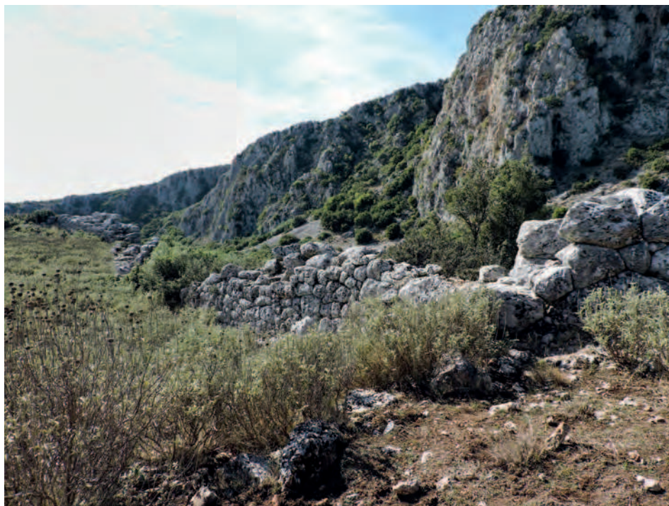
Fig. 3 — Fortification de Cassopé (cl. M.-P. Dausse).

chronologie 25 . Les travaux des archéologues grecs les confirment et les complètent petit à petit 26 . Deux jalons essentiels se dégagent, avec la définition de caractéristiques communes. D'abord la naissance des premières villes, à la fin du v e s. et dans la première moitié du iv e s. La planimétrie reste simple, il n'y a pas de tours et très peu d'entrées. L'enceinte utilise au maximum la roche en place. À titre d'exemple, à Élée, ville importante de Thesprôtie 27 l'imposante muraille qui enserre une superficie de dix hectares ne comporte