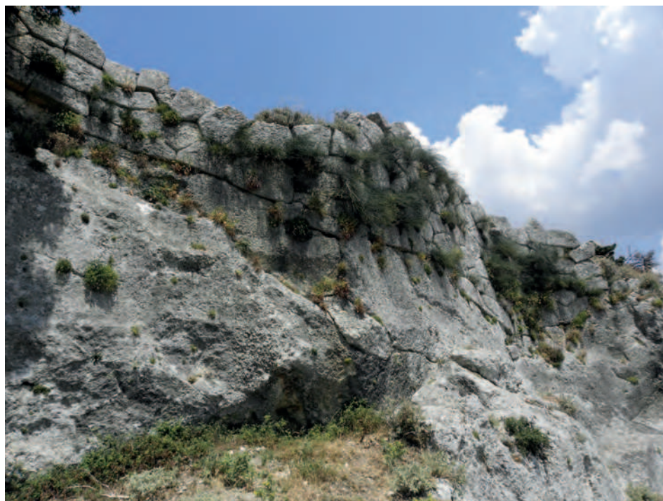
Fig. 2 — Fortification d'Amantia.

plus régulier sur les pentes plus douces 21 . Nous pouvons aussi citer celle de Cassopé 22 , dont la partie occidentale suit une courbe de niveau (fig. 3). Ces principes pourraient s'appliquer pour les fortifications très modestes de la Tsoumerka 23 . Perchées souvent à plus de mille mètres d'altitude, elles utilisent au maximum la roche en place. Mais avec un appareil très rustique. Nous y reviendrons 24 .