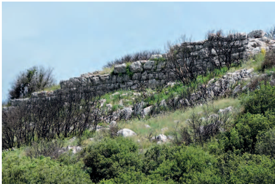
Fig. 7 — Fortification de Chrisoraki, muraille méridionale.

ou encore celle de Konitsa. La plaine de Kalpaki 64 est une région très stratégique située au débouché de la principale route qui vient de Chaonie (fig. 6) 65 , considérée par Pierre Cabanes comme la « porte d'entrée » 66 de la Molossie. Elle est densément occupée, par des installations diverses : les imposantes forteresses de Chrisoraki (fig. 7) et de Iéromnimi (fig. 8), le fortin de Ktismata, les larges terrasses de Léprovouni ou encore le site moins connu de Paléo Gribiani (fig. 9) 67 .