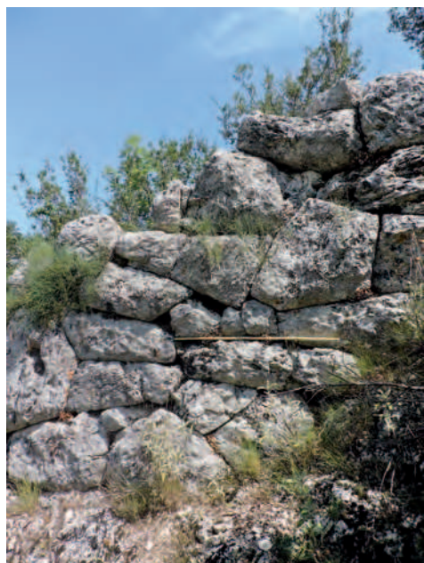
Fig. 9 — Fortification de Paléo Gribiani.