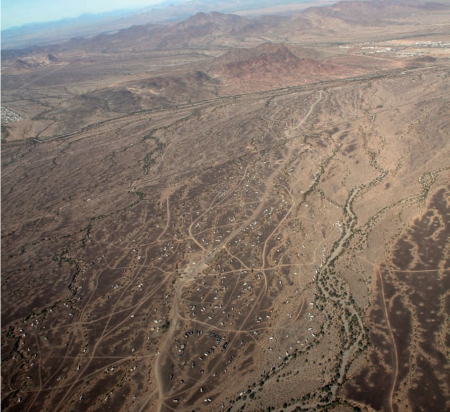
Figure 2: Une partie du désert occupée par les retraités mobiles au sud de Quartzsite.

Comment chez ces habitants mobiles qui ont, pour une grande partie d'entre eux, toujours un mode de vie sédentaire la moitié de l'année, le sentiment d'appartenance aux lieux se transforme-t-il pour devenir plus fort à l'égard de l'espace du désert qu'à l'égard de l'espace d'origine (MCHUGH, MINGS, 1996), au point qu'ils peuvent affirmer ne plus avoir aucun attachement au lieu de vie estivale, tout en continuant à le fréquenter? Nous émettons deux hypothèses. Premièrement, pour ces enquêtés qui sont passés d'un mode de vie sédentaire et urbain 2 à un mode de vie mobile, même si ce n'est finalement que pour six mois dans l'année, le changement d'habitat a été suffisamment totalisant pour les rendre disponibles à de nouvelles normes qui ont cours dans le désert (MERTON, 2001; BERGER, LUCKMANN, 2014). Deuxièmement, la nouvelle socialisation dans le désert met les enquêtés face à de nouvelles normes de vie sociale qui viennent contredire celles des socialisations passées (FASSIN, 2009).