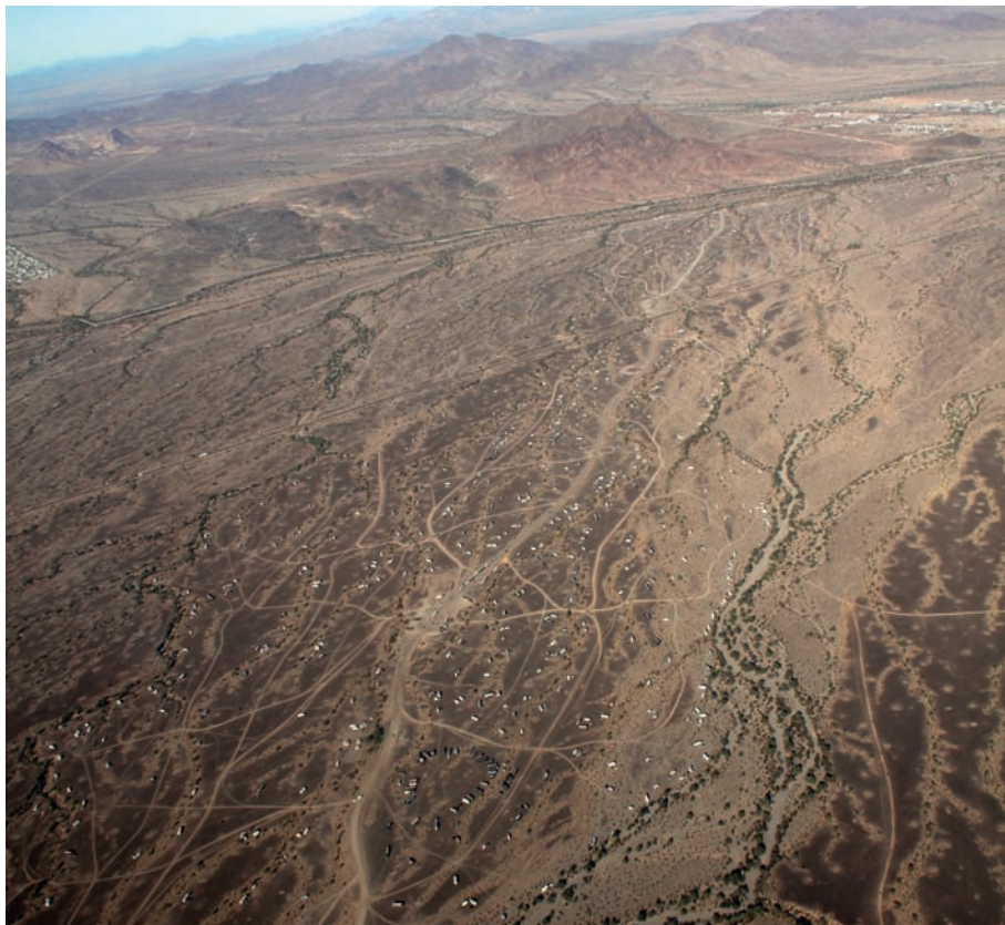
Figure 2: Une partie du désert occupée par les retraités mobiles au sud de Quartzsite (David Frati, janvier 2018).

Comment chez ces habitants mobiles qui ont, pour une grande partie d'entre eux, toujours un mode de vie sédentaire la moitié de l'année, le sentiment d'appartenance aux lieux se transforme-t-il pour devenir plus fort à l'égard de l'espace du désert qu'à l'égard de l'espace d'origine (MCHUGH, MINGS, 1996), au point qu'ils peuvent affirmer ne plus avoir aucun attachement au lieu de vie estivale, tout en continuant à le fréquenter? Nous émettons deux hypothèses. Premièrement, pour ces enquêtés qui sont passés d'un mode de vie sédentaire et urbain 2 à un mode de vie mobile, même si ce n'est finalement que pour six mois dans l'année, le changement d'habitat a été suffisamment totalisant pour les rendre disponibles à de nouvelles normes qui ont cours dans le désert (MERTON, 2001; BERGER, LUCKMANN, 2014). Deuxièmement, la nouvelle socialisation dans le désert met les enquêtés face à de nouvelles normes de vie sociale qui viennent contredire celles des socialisations passées (FASSIN, 2009).