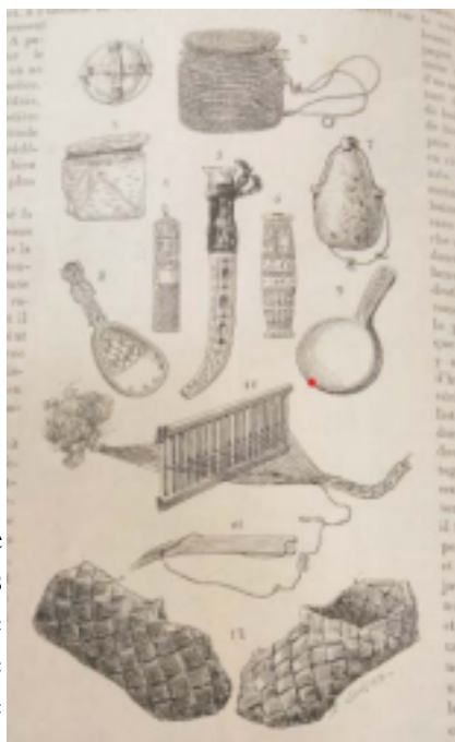
Ill. 3. Dessin d'objets lapons présents au musée du Trocadéro dans les années 1880, Bibliothèque nordique, Paris. Charles Rabot, « Explorations en

L'identification de la culture lapone à sa civilisation matérielle se retrouve dans les collections constituées, à partir des années 1850, par plusieurs musées européens au gré de collectes d'objets lapons, qu'il s'agisse d'ustensiles de la vie quotidienne ou d'objets sacrés 24,25 . Charles Rabot propose ainsi une planche de dessins représentant certains objets présents dans les collections du musée du Trocadéro 26 .