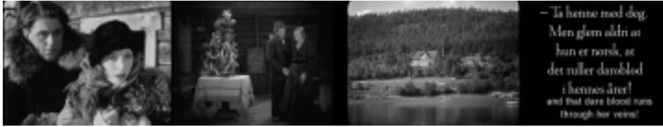
Ill. 7. La présentation des personnages norvégiens, Reviens, Laila ! , op.cit. , (14 min 21 sec ; 43 min 16 sec ; 1 h 25 min 10 sec ; 57 min 35 sec).

ou « guenilles » en suédois 46 . Il y a donc bien distinctement les Lapons d'un côté et les Norvégiens de l'autre : les rôles et les attributs sont très strictement déterminés et assignés à chaque peuple.