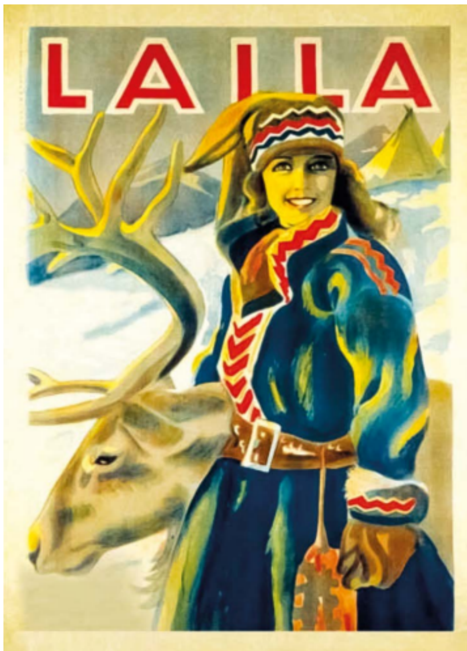
III. 1. Affiche du film Reviens, Laila ! George Schnéevoigt, Reviens, Laila ! , Lunde Film, 1929, Flicker Alley digital edition, Librairie nationale de Norvège.