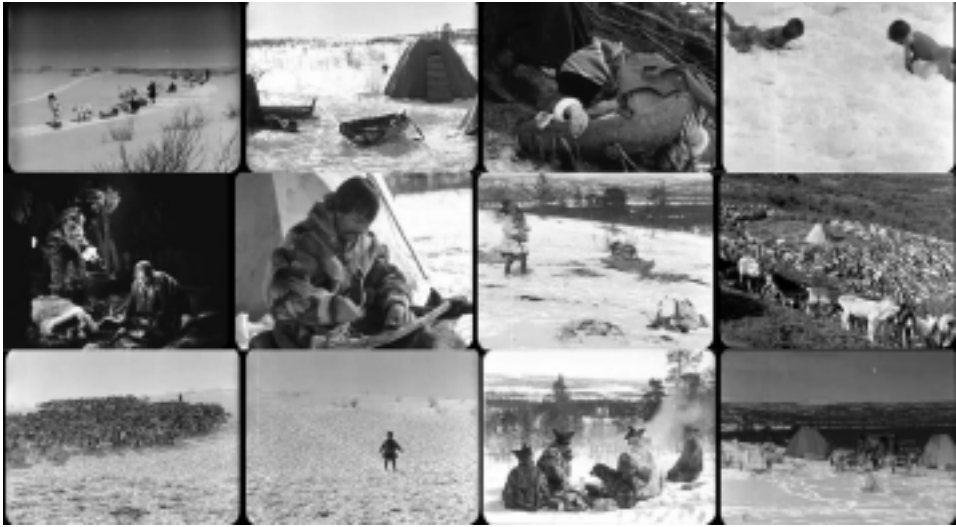
Ill. 4. La culture lapone en images. Reviens, Laila !, op.cit. , (1 h 06 min 43 sec ; 7 min 04 sec ; 17 min 36 sec ; 29 min 42 sec ; 18 min 50 sec ; 26 min 22 sec ; 26 min 26 sec ; 45 min 28 sec ; 6 min 49 sec ; 6 min 56 sec ; 7 min 47 sec ; 28 min 41 sec).

Le film met en scène des objets présents dans les collections muséales (traîneaux, lasso, etc.) et d'autres éléments constitutifs de la culture lapone tel le renne qui est « tout pour le Lapon 27 », « quelque chose comme Le Louvre ou le Bon Marché pour le Lapon 28 ». Certains parlent même de « civilisation du renne 29 ». Les représentations de l'habitat, à travers par exemple le motif de la tente, soulignent, elles aussi, une continuité entre d'une part, les descriptions journalistiques et littéraires et, d'autre part, le récit cinématographique qui s'apparente alors à un compte rendu des connaissances et représentations ayant trait aux Lapons dont les Européens disposaient à l'époque 30 .