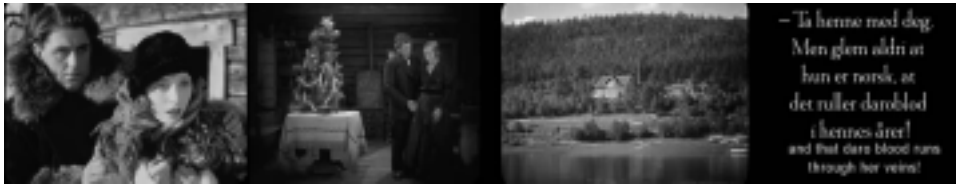
Ill. 7. La présentation des personnages norvégiens, Reviens, Laila ! , op.cit. , (14 min 21 sec ; 43 min 16 sec ; 1 h 25 min 10 sec ; 57 min 35 sec).

ou « guenilles » en suédois 46 . Il y a donc bien distinctement les Lapons d'un côté et les Norvégiens de l'autre : les rôles et les attributs sont très strictement déterminés et assignés à chaque peuple.