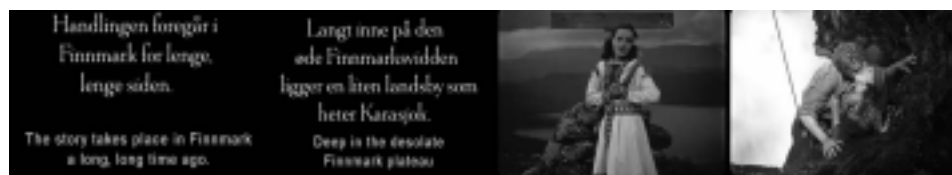
Ill. 5. La Laponie comme lieu de dramatisation dans Reviens, Laila ! , op.cit. , (1 min 52 sec ; 2 min 23 sec ; 1 h 56 min 02 sec ; 1 h 51 min 25 sec).

historique de l'aventurier - après le mercenaire, le flibustier et l'intrigant 32 ». Ainsi la dimension fantastique, accolée au Nord dès le Moyen Âge, irrigue-t-elle des romans d'aventure à travers la figuration « des lieux de l'errance sans espoir dont les maelströms inspirèrent Jules Verne et Edgar Allan Poe 33 ». Comme le discours de l'aventure fonctionne d'abord sur le motif de l'éloignement 34 , il n'est pas étonnant que la Laponie en devienne un terrain privilégié et Reviens, Laila ! utilise ce registre en incitant les spectateurs à s'identifier à la famille norvégienne et à s'imaginer en aventuriers évoluant dans les confins de l'Europe du Nord. La dimension aventurière repose aussi sur le choix de personnages très stéréotypés, car « la préférence exotique se double presque toujours d'une attirance pour certains contenus au détriment d'autres 35 ». Elle apparaît avant tout comme un regard particulier posé sur l'événement, une représentation du fait plutôt que le fait lui-même 36 . Ce regard déploie une « romantisation » de l'espace raconté et filmé à travers un éloignement autant géographique que temporel, comme le suggèrent les scènes présentées ci-après (Ill. 5).