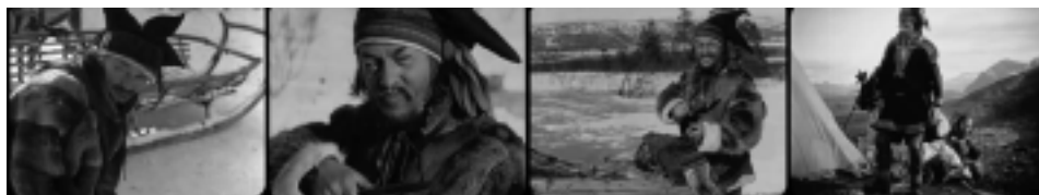
Ill. 2. Présentation visuelle des Lapons. Reviens, Laïla ! , op.cit. , 3 min 07 sec ; 5 min 29 sec ; 6 min 06 sec ; 52 min 09 sec.

représente, en laissant hors champ la diversité vestimentaire longuement étudiée par Yves Delaporte 17 .