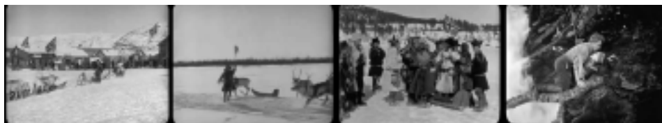
Ill. 14. Le colonialisme norvégien, Reviens, Laila !, op.cit. , (1 h 08 min 23 sec ; 1 h 21 min 10 sec ; 1 h 21 min 26 sec ; 1 h 50 min 53 sec).

D'autres péripéties de l'intrigue confirment une telle vision, par exemple lorsque Laila est en danger de mort sur la falaise, c'est un Norvégien qui vient à son secours. Comment ne pas y voir l'image d'une Norvège qui vient sauver la Laponie, voire même le symbole d'une femme norvégienne sauvée d'une Laponie hostile. De même, le fait que Laila se marie finalement avec un Norvégien, et non avec son cousin lapon comme il avait été décidé, peut aussi être vu comme une métaphore de la victoire de la Norvège sur la Laponie. Autant d'éléments, scénaristiques et visuels, qui suggèrent que l'imaginaire colonialiste fait partie intégrante du film, et qui nous incitent à nous interroger sur la place de cette œuvre dans la constitution du processus boréaliste, et plus largement sur le rôle joué par l'Arctique européen, et notamment la Laponie, dans celui-ci.