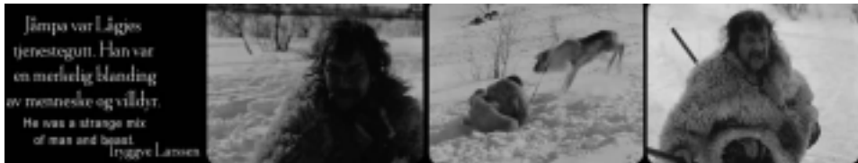
Ill. 9. Les Lapons sauvages, Reviens, Laila ! , op.cit. , (5 min 44 sec ; 5 min 49 sec ; 6 min 23 sec ; 16 min 03 sec).