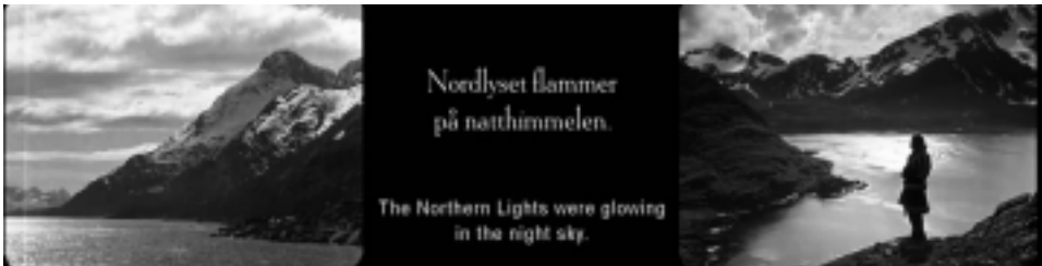
Ill. 6. Les paysages lapons, Reviens, Laïla ! , op.cit. , (1 min 59 sec ; 38 min 28 sec ; 59 min 33 sec).

La Laponie, en tant que territoire, est un personnage à part entière du film. Ce n'est pas seulement un décor, c'est également un cadre de vie qui, selon les théories géo-climatiques encore présentes au XIX e siècle, serait déterminant dans le développement et le degré de civilisation des populations qui y sont installées 37 . C'est par son caractère lointain, exotique et mystérieux que la Laponie a attiré les ethnologues, journalistes et aventuriers de tous horizons. Lors de cette période les études et publications consacrées à la Laponie se focalisent sur sa géographie : « La Laponie embrasse toute cette partie de l'Europe septentrionale qui s'étend entre le 280 et le 59° de longitude ouest, et entre le 65° et le 71° de latitude nord 38 . » Reprenant cet héritage, le film offre des plans paysagers qui cochent toutes les cases de l'imaginaire lapon et contentent les spectateurs, il mentionne également dans ses intertitres les aurores boréales, motif caractéristique des contrées nordiques et source de fascination.