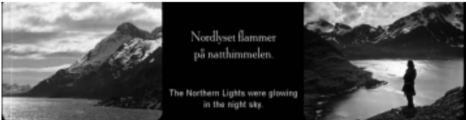
Ill. 6. Les paysages lapons, Reviens, Laïla ! , op.cit. , (1 min 59 sec ; 38 min 28 sec ; 59 min 33 sec).

La Laponie, en tant que territoire, est un personnage à part entière du film. Ce n'est pas seulement un décor, c'est également un cadre de vie qui, selon les théories géo-climatiques encore présentes au XIX e siècle, serait déterminant dans le développement et le degré de civilisation des populations qui y sont installées 37 . C'est par son caractère lointain, exotique et mystérieux que la Laponie a attiré les ethnologues, journalistes et aventuriers de tous horizons. Lors de cette période les études et publications consacrées à la Laponie se focalisent sur sa géographie : « La Laponie embrasse toute cette partie de l'Europe septentrionale qui s'étend entre le 280 et le 59° de longitude ouest, et entre le 65° et le 71° de latitude nord 38 . » Reprenant cet héritage, le film offre des plans paysagers qui cochent toutes les cases de l'imaginaire lapon et contentent les spectateurs, il mentionne également dans ses intertitres les aurores boréales, motif caractéristique des contrées nordiques et source de fascination.