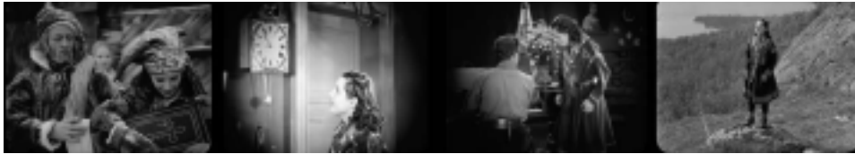
Ill. 12. La fascination pour la culture norvégienne, Reviens, Laila !, op.cit. , (1 h 18 min 35 sec ; 1 h 30 min 05 sec ; 1 h 31 min 02 sec ; 1 h 35 min 05 sec).

Quand elle découvre la culture et le mode de vie norvégiens Laila paraît fascinée, son émerveillement suggère que sa vraie nature n'a pu être effacée par des années de vie au milieu des Lapons, son sang norvégien lui conférant un goût que les Lapons n'ont pas.