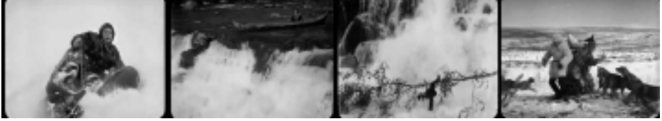
Ill. 8. La Laponie sauvage, Reviens, Laila ! , op.cit. , (10 min 24 sec ; 1 h 47 min 46 sec ; 1 h 48 min 19 sec ; 2 h 12 min 32 sec).