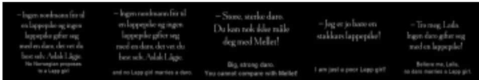
Ill. 11. L'infériorisation des Lapons, Reviens, Laila !, op.cit. , (1 h 15 min 51 sec ; 1 h 15 min 54 sec ; 1 h 42 min 42 sec ; 1 h 51 min 45 sec ; 2 h 03 min 56 sec).

En se qualifiant elle-même de « simple pauvre Lapone », Laila intériorise l'infériorité ressentie par les Lapons vis-à-vis des Norvégiens. De même, l'idée que Laila puisse épouser le Norvégien semble inconcevable pour tous les personnages.