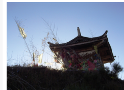
Sanctuaire en contrehaut de la plaine de