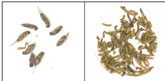
Illustration 1 : photographies de grillons (à gauche) et vers de farine (à droite)

Le questionnaire comporte trois types de mesure de l’acceptation :