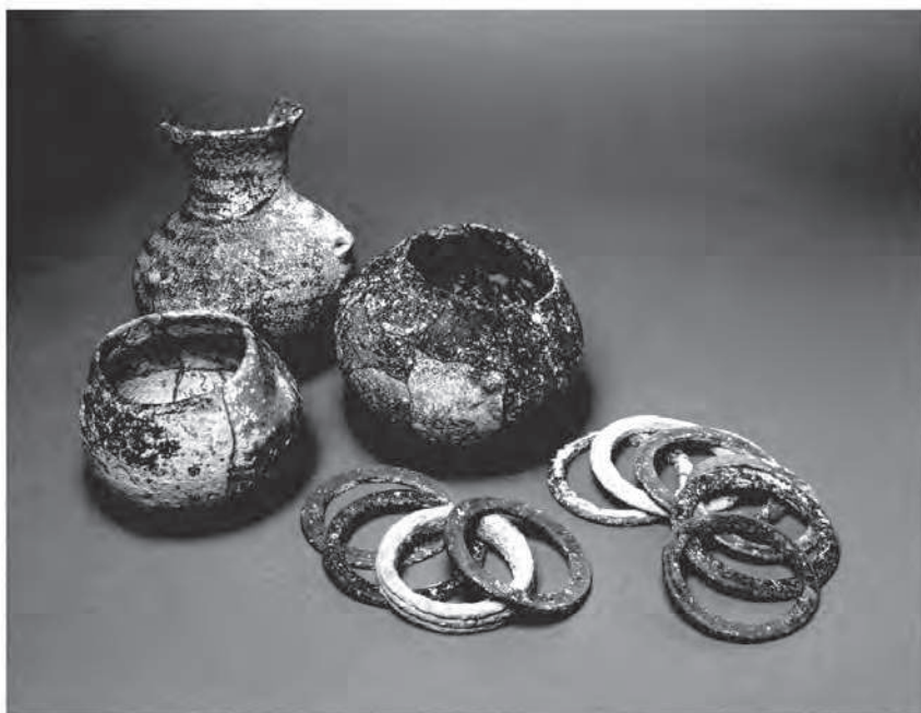
FIG. 1. Longueil-Sainte-Marie « Le Barrage » (Oise).

La jeune femme est repliée sur le côté gauche, la tête au sud. Trois vases décorés, onze bracelets en pierre, quatorze dentales, une plaquette d'os gravé constituent le mobilier d'accompagnement funéraire. La partie allant du haut du crâne au bas du dos est ocrée et l'un des récipients décorés contient de l'ocre. Au bras droit, elle porte, au-dessus du coude, cinq bracelets : trois en schiste et deux en calcaire dont l'un est rainuré, au bras gauche six bracelets ont été enfilés au-dessus du coude, cinq en schiste et un en calcaire. (Responsable d'opération D. Maréchal, MARÉCHAL et al. 2007)