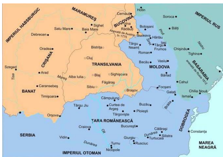
Carte 2 : la Transylvanie au XVIII e et début du XIX e siècle 2

par rapport aux lieux considérés comme encore plus « barbares » de l'Empire ottoman et du monde musulman. Au début du XVIII e siècle, le Royaume hongrois intégrant à l'époque la Transylvanie, se séparait de l'univers oriental de l'Empire ottoman et entraît sous l'influence de l'Empire des Habsbourg (cf. carte 2). La Transylvanie, à la frontière entre ces deux empires, apparaît ainsi sur la faille de la rencontre et de la séparation entre « barbarie » et « civilisation ». Elle reste cependant un espace lointain, aux marges du Royaume hongrois, ce qui est aussi suggéré par son appellation. La « Transylvanie », Trans-sylvania , signifie « Au-delà des forêts » 1 .