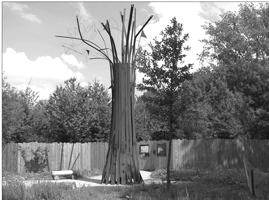
Fig. 4 – L'œuvre de Jacques Simon évoquant la monumentalité de l'architecture de bois locale du XIX e siècle avant notre ère.

«Par contre, si 94 % des personnes interrogées ont bien visité ce jardin, seuls 13 % ont eu accès au livret d'accompagnement. Pour ceux-là, la perception évolue fortement : 60 % trouvent le jardin intéressant, 77 % le jugent alors même "bien" ou "très bien" et la présentation archéologique excellente (17 %) ou bonne (39 %).»