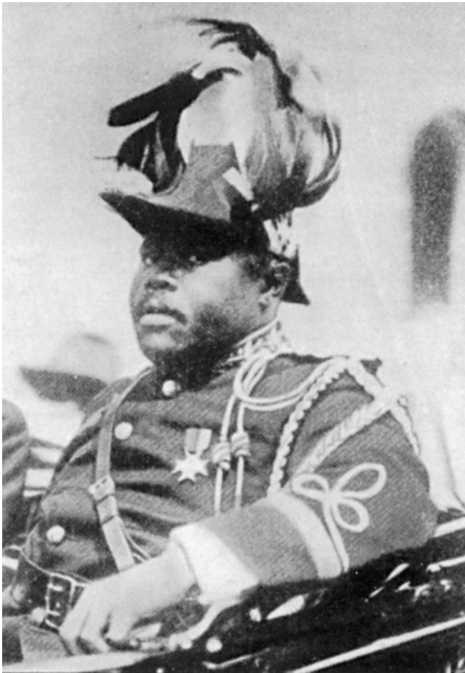
Marcus Garvey en 1920