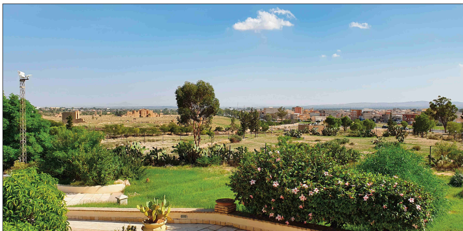
Figure 2 : Sbeitla (Centre-ouest de la Tunisie) : un potentiel touristique encore inexploité