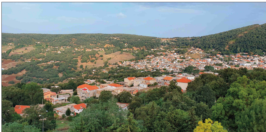
Figure 1 : Aïn Draham (Nord-ouest de la Tunisie) : le code forestier régissant l'exploitation forestière privilégie les grandes entreprises au détriment des jeunes de la région souhaitant s'établir comme sylviculteur