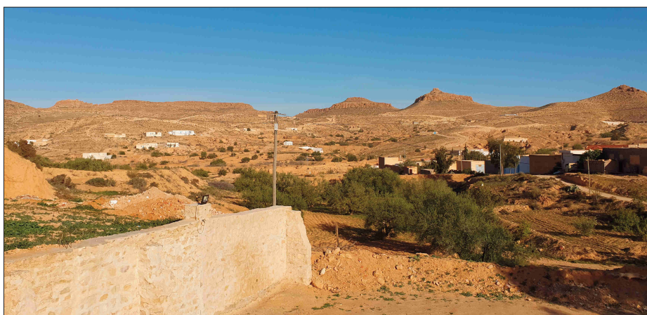
Figure 3 : Beni Khedache (Sud-est de la Tunisie) : un terroir en cours de valorisation

La recherche du lien entre employabilité et mobilité(s) pose comme hypothèse de départ que l'emploi, parmi l'ensemble des facteurs push identifiés, demeure le plus