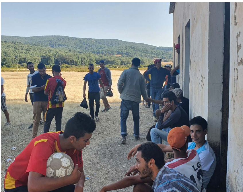
Photo 1 : Enquête auprès de jeunes avant un match de football à Aïn Draham Oued Zen, juillet 2020.

Cette approche, novatrice dans le contexte de déconfinement et vu les contraintes de terrain, a permis de soumettre le questionnaire à 1 004 jeunes hommes et femmes sur une période allant du 20 juillet au 20 septembre 2020. Il est nécessaire de rappeler que les communes servant de support à cette recherche se situent dans des zones frontalières de la Tunisie de l'intérieur. Par conséquent, il a fallu obtenir des autorisations pour pouvoir interroger les jeunes au sein des espaces publics, qu'ils soient urbains ou ruraux. L'imbrication de notre recherche à une composante opérationnelle d'un programme de coopération internationale associant les communes n'a pas été suffisante pour nous garantir, à la fois, un accès aux territoires et aux populations qui y résident. En ce qui concerne les espaces frontaliers, ce sont les aspects sécuritaires qui ont primé sur toute autre considération et nous avons donc été orientés vers l'institution du gouvernorat, siège du pouvoir politique et de la puissance publique. Bien que depuis 2011, les projets de coopération internationale et les programmes de recherche aient contribué à familiariser les pouvoirs régionaux avec ce type d'enquête, le contexte géographique et l'optique des no man's lands , caractérisant les espaces reculés d'Aïn Draham,