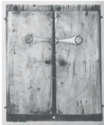
Fig. 04. Le même triptyque, refermé

un choix soigneux, ce qu'on appelle un programme iconographique. Dans la chronologie de l'histoire telle qu'on peut la recomposer, la scène centrale, celle de la naissance du héros, vient la première. Ensuite on lit ce diptyque comme un livre. On commence en haut du volet gauche par l'épisode qui inaugure le déroulé des épisodes qui mènent à la mort du héros, et qu'on pourrait voir ensemble comme une « Passion longue » – si l'on réserve le terme de « Passion courte » à ce qui commence avec l'Arrestation ou même à la Condamnation comme font les chemins de croix traditionnels. On continue en bas par la visite aux Enfers, qui a lieu pendant les jours sombres de Pâques, ceux que les compositeurs illustreront par les Leçons de ténèbres . Puis on passe au volet de droite avec l'Assomption, inscrite dans la liturgie chrétienne au VIII e siècle, qui manifeste non seulement que Marie monte au ciel, mais qu'elle le fait vers son fils glorieux. C'est seulement si l'on referme des deux petits volets qu'on les voit former une croix (Fig. 04).