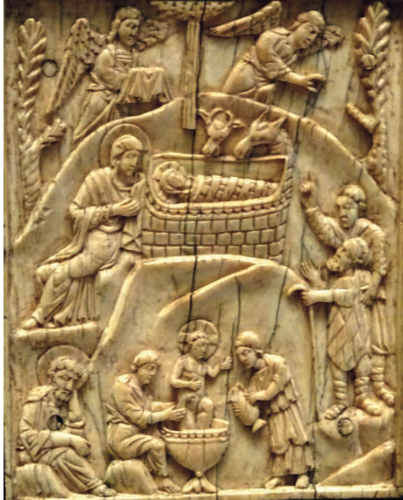
Fig. 06. Nativité

Dans une image à peu près contemporaine du tableau ci-dessus, un ivoire peut-être sculpté à Venise aux XII e -XIII e siècles (Fig. 06), les zones creusées sont organisées en paysage, comme sur la peinture, pour produire une image unifiée.