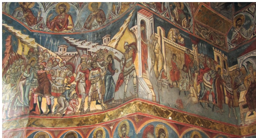
Fig. 16. Arrestation et Reniement de Pierre. 1535