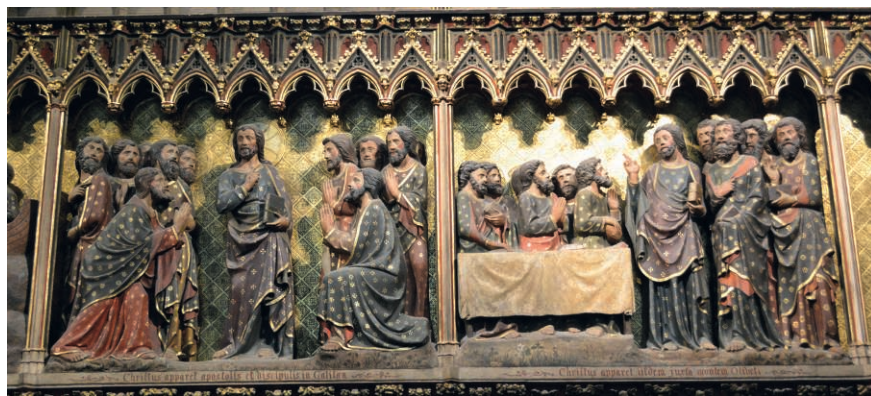
Fig. 14. Jésus apparaît aux disciples, puis aux apôtres

Du côté sud, qu'on dit être un peu plus tardif et dater du début du XIV e siècle, les scènes sont au contraire séparées par des colonnettes. Il s'agit de la suite de l'histoire. L'exemple ci-dessous (Fig. 14), qui suit l'épisode de l'Incrédulité de Thomas, montre deux scènes après la Résurrection, Jésus apparaissant aux disciples en Galilée, et Jésus apparaissant aux apôtres le jour de l'Ascension. La construction « dialoguée » de chaque image est très nette, qu'elle soit avec un centre comme à gauche, ou construite sur une simple symétrie comme à droite. Les colonnettes pourraient être ôtées sans inconvénient : les limites de chaque épisode ou scène seraient claires, même si ne savait plus les identifier.