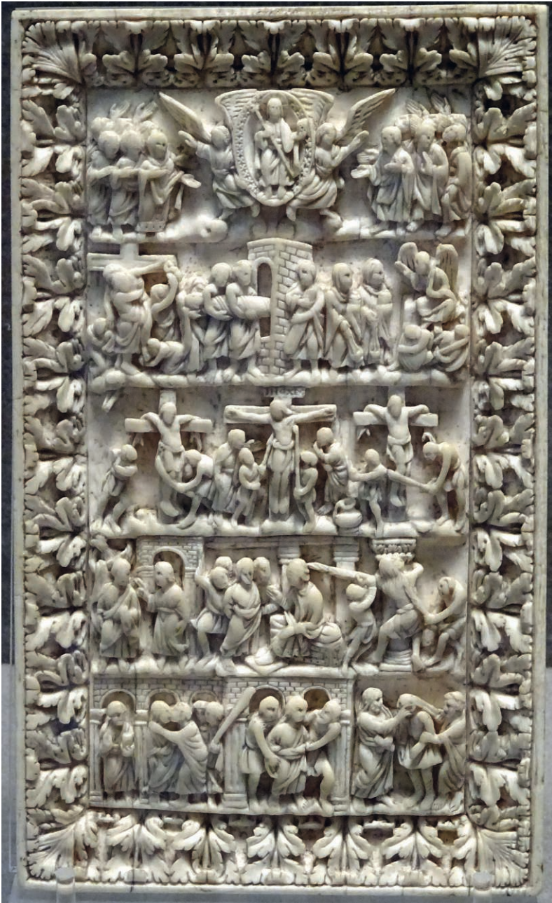
Fig. 12. Épisodes de la Passion de Jésus Plat de reliure en ivoire. Louvre OA 6000