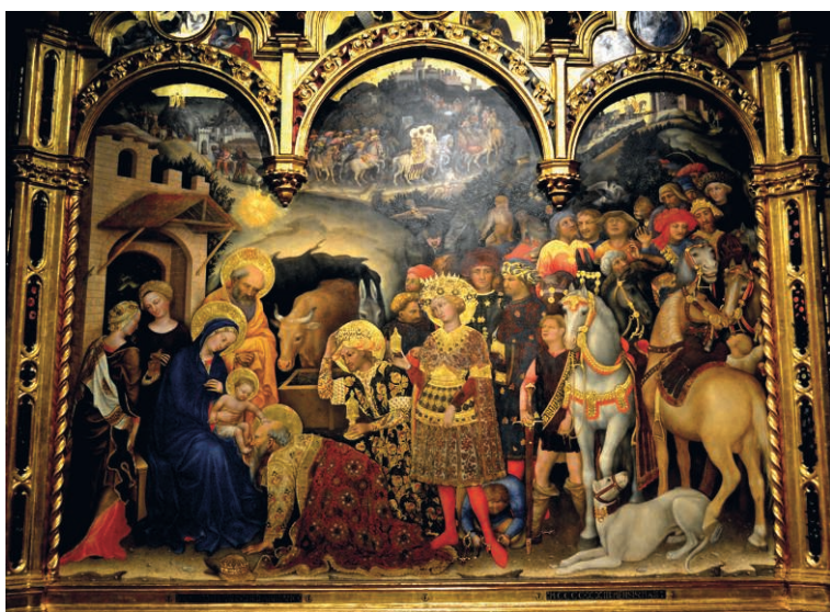
Fig. 07. Gentile da Fabriano. L'Adoration des mages , détail

Il existe un cas intéressant et célèbre qui peut servir de transition avec le problème posé par ces visiteurs du nouveau-né que sont les bergers et les rois mages. Il s'agit d'un tableau, beaucoup plus grand (300 × 282 cm) peint par Gentile da Fabriano en 1421-1422 pour la chapelle Strozzi de Santa Trinità, à Florence, et aujourd'hui au Musée des Offices (Fig. 07).