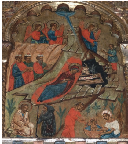
Fig. 22. Icône de la Nativité

Iconostase de l'église de Voroneț (Moldavie roumaine)