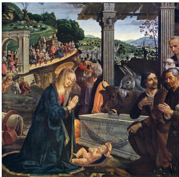
Fig. 08. Ghirlandaio. Adoration des bergers