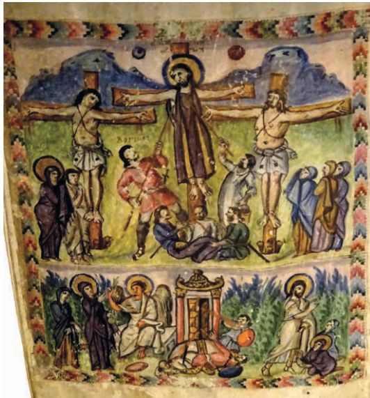
Fig. 02. Crucifixion, Femmes au tombeau

Un autre exemple est la page peinte (Fig. 02) de l'Évangélaire syriaque de Rabbula (daté 586) 4 . En haut, on retrouve une disposition déjà classique de la Crucifixion : Jésus au centre, les larrons sur les côtés, le porte-lance et le porte-éponge, Marie et Jean et les Trois femmes, enfin aux pieds de Jésus les trois soldats jouant aux dés. En bas est représentée la scène de la Résurrection : les gardes renversés devant le tombeau vide, à gauche l'ange répondant aux deux femmes qui, à droite, rencontrent Jésus ressuscité 5 . Dans cette disposition, le rapprochement des deux images vaut comme une leçon : le contraste souligne la gloire de la Résurrection. Mais la leçon ne porte que si quelqu'un raconte l'histoire 6 ou ses éléments essentiels.