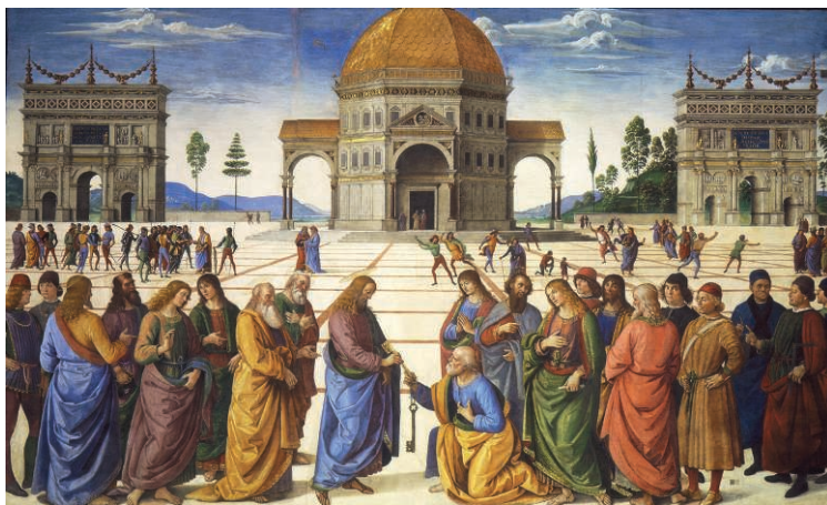
Fig. 09. Le Pérugin. La Remise des clés à saint Pierre