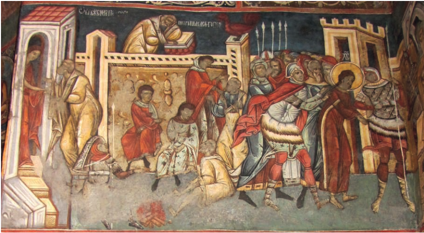
Fig. 17. Reniement de Pierre. 1535