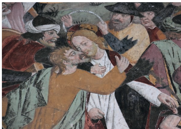
Fig. 24. Baiser de Judas