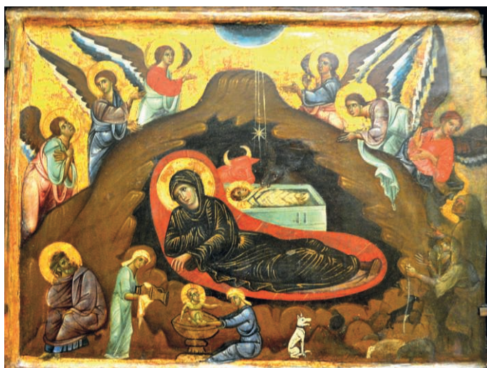
Fig. 05. Guido da Siena. Nativité

Même si les réalisations diffèrent beaucoup, il existe de nombreux exemples d'images qui cherchent à rassembler plusieurs épisodes rattachés l'un à l'autre 8 . Nous avons vu plus haut que le panneau central du petit triptyque de Constantinople (Fig. 03) avait organisé avec l'épisode de la Nativité une image assez complexe. Si on le regarde bien, on voit que ce panneau comporte des zones creusées à des profondeurs diverses, permettant d'isoler les scènes. Un procédé comparable est à l'œuvre dans cette peinture (Fig. 05) de Guido da Siena (milieu siennois, XIII e siècle) 9 .