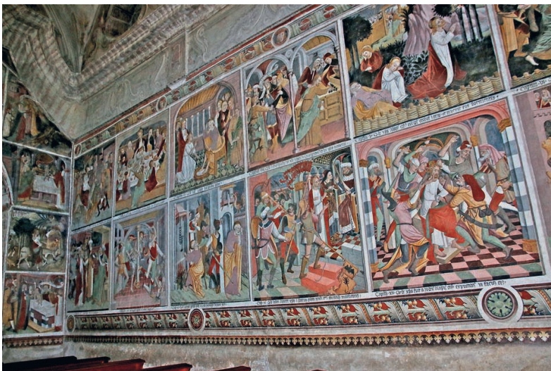
Fig. 19. Nef, mur sud. Chaque case est numérotée (chapitre I, II, III, etc.) et légendée Notre-Dame des Fontaines, La Brigue