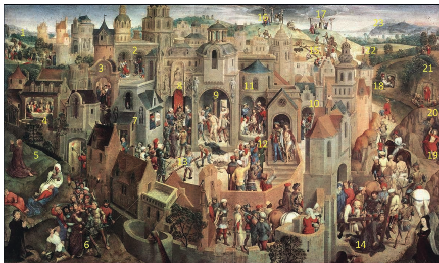
Fig. 11. Hans Memling, Scènes de la Passion du Christ