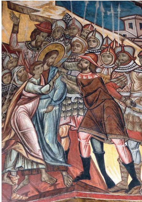
Fig. 23. Le Baiser de Judas Église de Humor (Moldavie roumaine)

Une trentaine de personnes ont participé, qui toutes étaient françaises, ayant fait des études, et pour certaines catholiques et pratiquantes. Une seule personne a réussi à mettre les épisodes dans l'ordre. Les confusions ont été nombreuses et, curieusement, même dans le cas d'épisodes connus comme le Baiser de Judas, déclencheur de l'Arrestation de Jésus. Plusieurs des personnes interrogées ont ainsi pris pour Jean, disciple préféré de Jésus, le jeune homme qui embrasse Jésus. Cet homme au doux visage (Fig. 23) ne pouvait pas être Judas, le méchant, le traître qui a vendu Jésus pour trente deniers, souvent représenté sur les murs des églises catholiques de la même époque (Fig. 24) comme un homme mûr au nez crochu, la caricature du juif.