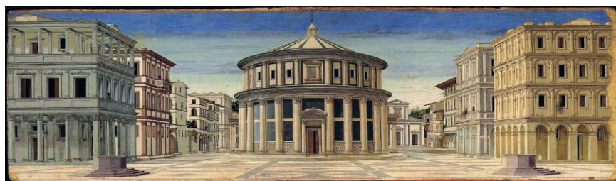
Fig. 10. Attribution discutée. La Cité idéale

Vers 1475-1480. Musée des Marches, Urbino