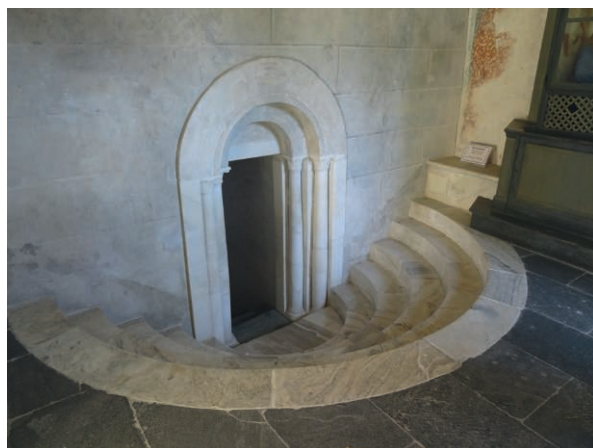
Fig. 26. Varallo (Piémont italien)

L'inventeur des Monti sacri ou « Monts sacrés » est le père franciscain Bernardino Caimi (1425-1500). Afin qu'on puisse « visiter les lieux saints » sans avoir à s'y rendre, et aussi afin d'utiliser le prestige des lieux célèbres de Palestine, il eut l'idée de « reproduire » chez lui, en Italie, les sanctuaires de Palestine, c'est-à-dire les lieux qui évoquent la Vie de Jésus sur terre. Il fit ainsi bâtir à Varallo dans le Piémont, sur une terrasse naturelle qui surplombe la ville, une Terre sainte en petit format, reconstruisant « à l'identique » l'église du Saint Sépulcre où se trouve la tombe de Jésus, la grotte de Bethléem où il est né (Fig. 26), la maison de Nazareth, le Cénacle où aurait eu lieu le dernier repas de Jésus avec ses disciples, et donc le Calvaire.