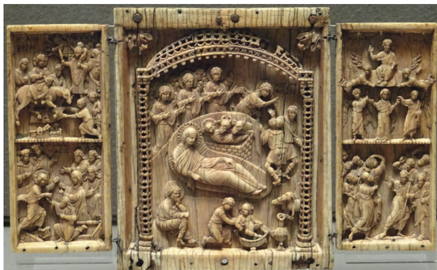
Fig. 03. Nativité, Entrée à Jérusalem, Visite aux enfers, Ascension de Marie

Un bon « terrain » pour explorer ces diverses contraintes ou ces hasards est la diversité des ivoires sculptés, dont il existe de nombreux exemples dès l'époque carolingienne. L'exemple ici (Fig. 03), un petit triptyque de Constantinople réalisé à la fin du x e siècle, a l'avantage d'être complet.