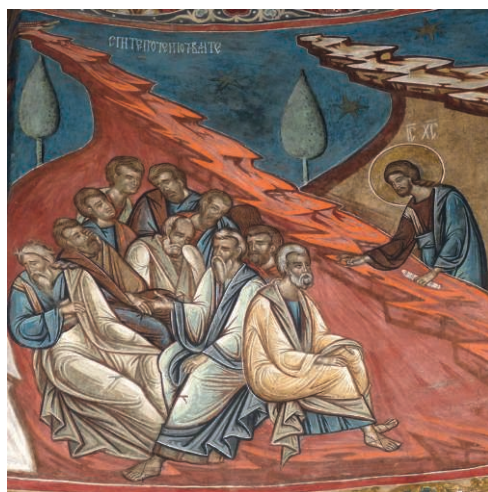
Fig. 25. Jardin des Oliviers, Jésus revient vers ses disciples endormis