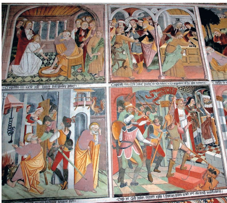
Fig. 20. La Brigade

Le récit court sur deux registres. Il débute sur le mur Sud (Fig. 19 ci-dessus) à droite de l'arc triomphal, en haut, par l'Entrée à Jérusalem (1), se poursuit par la Cène (2), le Lavement des pieds (3) et la Trahison de Judas (4), scène partagée en deux parties bien distinctes qui montre le traître deux fois : à gauche, ourdissant avec les prêtres le complot contre le Christ ; à droite, recevant le prix de la trahison. Suivent le Jardin des Oliviers (5), l'Arrestation (6), la Comparution de Jésus devant le Grand-prêtre Anne (7), et sur le registre inférieur, près du chœur, la Comparution devant Caïphe (8) et la Flagellation (9). Après cet épisode situé à une place tout à fait inhabituelle, nous y reviendrons, vient la seconde image « intégrative » de cet ensemble : le Reniement de Pierre (10).