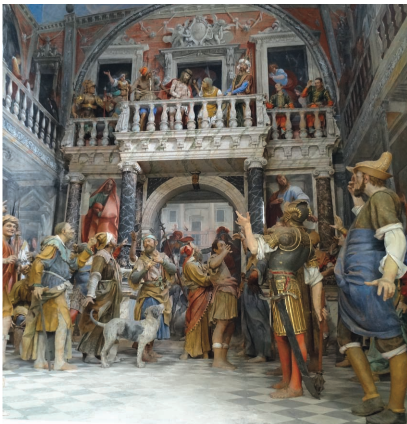
Fig. 28. Varallo, Ecce Homo

Personnages de bois peints et décors en trompe-l'œil