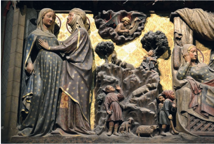
Fig. 13. Visitation, Annonce aux bergers, Nativité (partie)

Côté nord du chœur, les reliefs sont de la fin du XIII e siècle 21 : on a des scènes distinctes mais qui ne sont pas séparées par des frontières trop explicites.