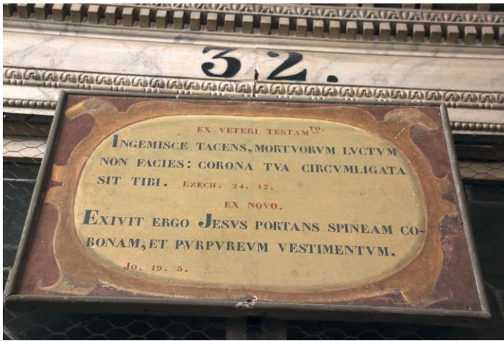
Fig. 27. Entrée de la chapelle 32 dédiée à l'Ecce Homo

Chaque chapelle est construite à la manière d'un « tableau vivant », englobant dans une unité de temps, d'espace et d'action des personnages représentés par des sculptures en bois peint, grandeur nature, placés dans un décor à fresques. Des phrases des Écritures, inscrites sur son fronton, introduisent l'épisode auquel elle est dédiée (voir Fig. 27). Mais ces tableaux vivants n'en visent pas moins à être appréhendés, grâce au « récit » évangélique sous-jacent, dans une continuité narrative, comme autant de phases successives de la Vie de Jésus.