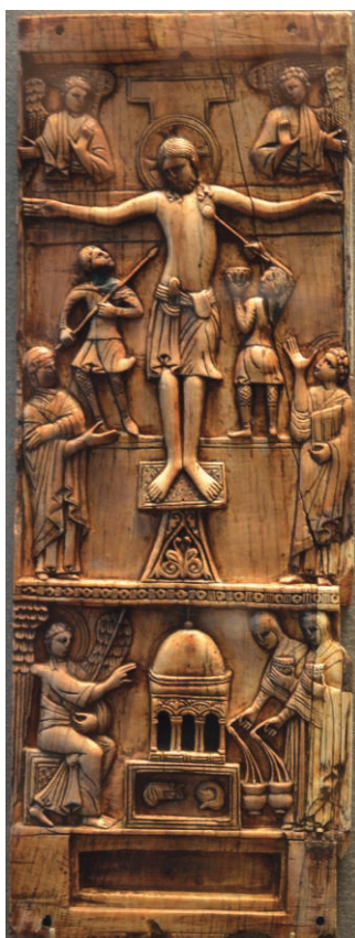
Fig. 01. Crucifixion et Femmes au tombeau

la Crucifixion. Nous pouvons donner deux exemples différents. L'un est une plaque d'ivoire (Fig. 01) de la fin du XI e siècle, faite en Italie du Sud (Amalfi ou Salerne). Dans la partie supérieure, on voit une Crucifixion symétrique (en haut deux anges, au-dessous le porte-lance et le porte-éponge, en bas Marie et Jean ; les différents couples de personnages sont logés à des hauteurs différentes). Dans la partie inférieure, l'ange accueille les deux femmes venues pour les rites des morts près de la tombe vide de Jésus (on voit les suaires enroulés qui prouvent la résurrection). La démonstration est simple et claire : le mort n'est pas mort. Évidemment, ce n'est simple et clair que pour celui qui connaît déjà l'histoire, car tout autre visiteur serait bien en peine d'induire aucune leçon de ces deux images l'une au-dessous de l'autre, même s'il reconnaît dans la seconde qu'il s'agit d'un tombeau.