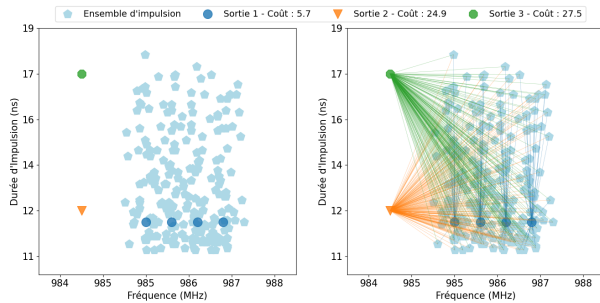
FIGURE 3 – Résultat de la classification de l'ensemble d'impulsion 0.

d'abord, un algorithme de clustering a été appliqué sur la fréquence et la durée d'impulsion pour séparer chaque impulsion du signal en plusieurs clusters avant de les regrouper grâce à un clustering ascendant hiérarchique combiné aux distances de transport optimal. Puis, à partir de ces clusters fusionnés, nous avons extrait des caractéristiques pour les comparer à une base de données de référence en utilisant la distance du transport optimal. Les résultats obtenus sur les données simulées sont très encourageants et permettent d'identifier avec grande confiance la classe de l'émetteur. La méthodologie peut gérer plus de 60 classes à identifier et peut facilement être agrémentée de nouvelles classes.