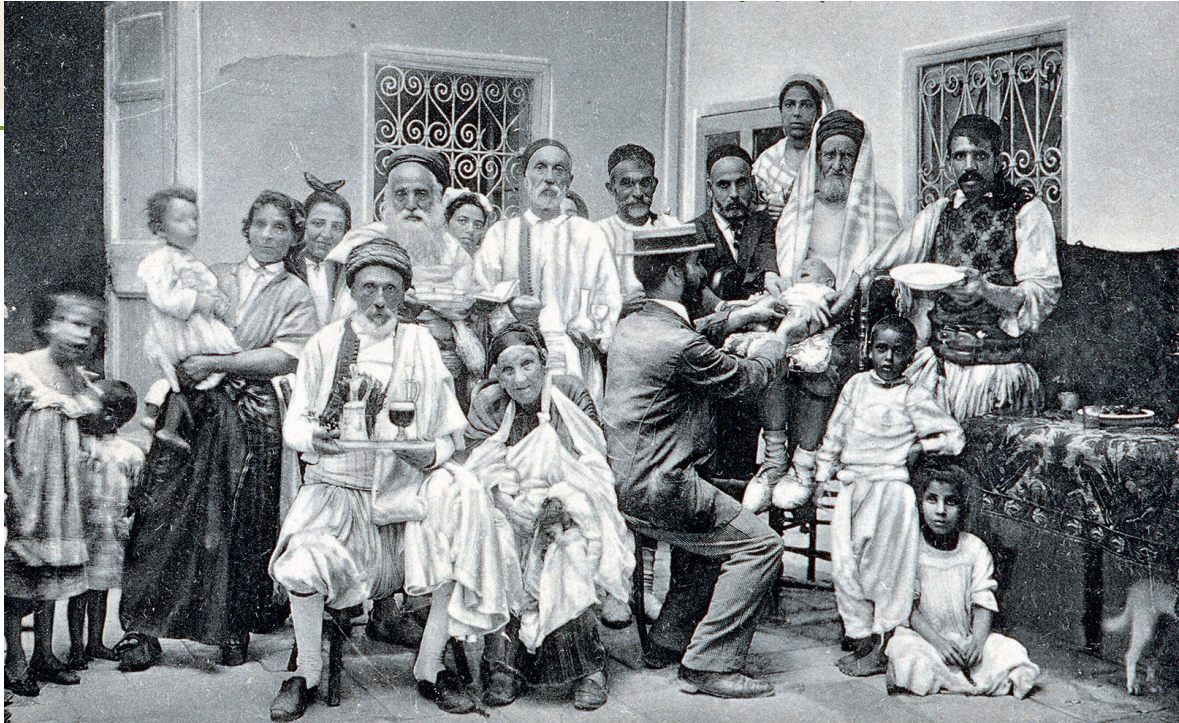
▲ Fête juive de circoncision (carte postale de 1910). Nombreux et dynamiques, les juifs de Tunisie occupent des positions solides et maintiennent vivaces les traditions religieuses et culturelles.

des années 1950 près de 8000 habitants juifs sur plus de 11 000 habitants, dans un quartier misérable qui n'a pas cessé de se dégrader ; soit une densité de 900 habitants à l'hectare, avec des immeubles qui ne dépassent pas les deux ou trois étages et des familles de cinq membres et plus. On est à l'évidence dans une situation de surpeuplement. Huit mille habitants dans le vieux ghetto : cela signifie que la majorité des juifs de la capitale s'est déversée dans la ville nouvelle et plus particulièrement dans certains quartiers, le Passage, Lafayette, la première porte du Belvédère, ou les banlieues balnéaires. Dans la ville moderne qui s'édifie au xx e siècle, les juifs sont omniprésents comme propriétaires, comme locataires d'appartements, et même comme architectes, tel le fameux Victor Valensi auquel on doit la grande synagogue, de nombreuses maisons particulières de style dit néomauresque, un plan de sauvegarde de la médina, etc.