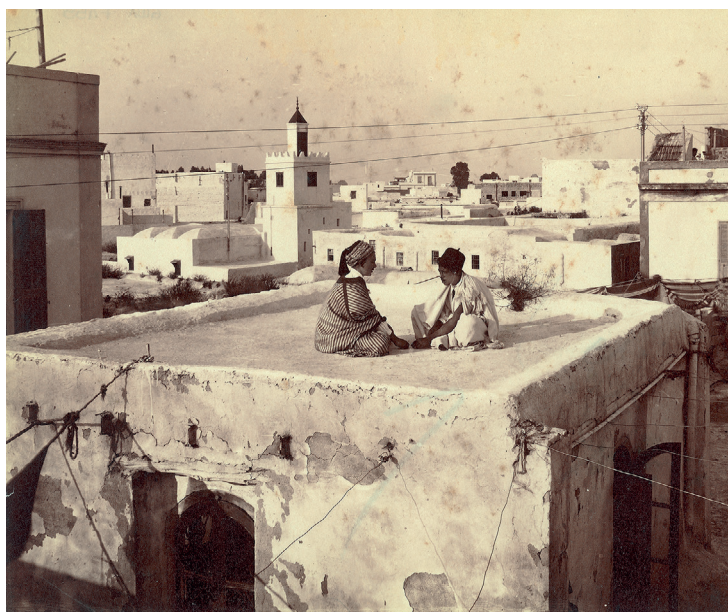
LA MÉDINA Dans la ville arabe, organisée autour de la mosquée de la Zitouna et de la citadelle de la Kasbah, demeures bourgeoises et logements modestes bordent les ruelles commerçantes (photo de 1910).

L'administration française partage ses institutions entre les nouveaux quartiers (hôtel de la Monnaie, hôtel