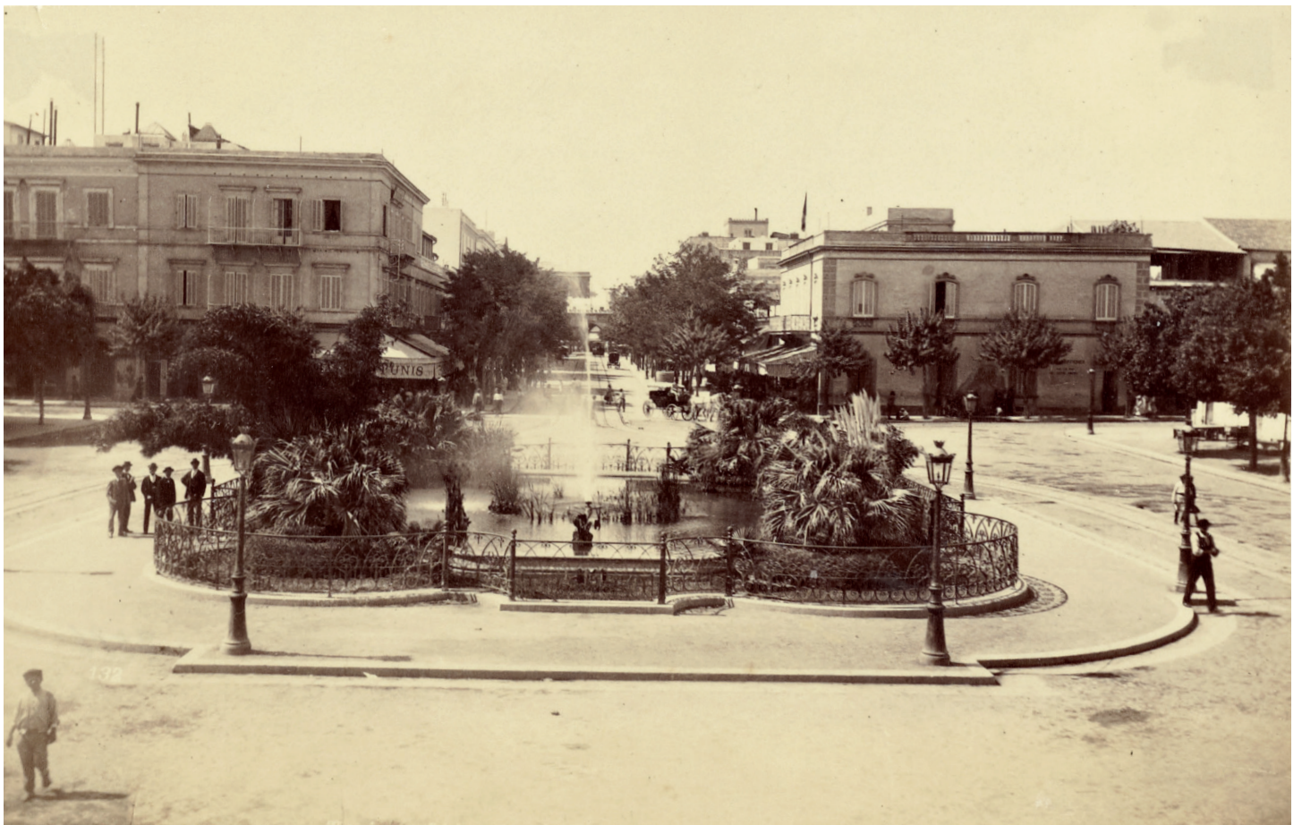
L'AVENUE DE FRANCE Les colons habitent la ville européenne : larges avenues bordées d'immeubles aux façades classiques, fontaines, commerces, cafés. Au bout de l'avenue, la Porte de France ouvre sur la ville arabe.

La migration maghrébine est, elle, liée au travail, aux affinités religieuses (sur la route de La Mecque ou pour des études à la mosquée-université de la Zitouna), parfois à des besoins de refuge. Algériens, Tripolitains et Marocains sont disséminés dans le tissu de la ville, selon les raisons de leur émigration et leur statut social. Les Algériens, citadins ou ruraux, se concentrent autour du quartier de Bab el-Jazira, où ils entretiennent des commerces. D'autres sont notaires, écrivains publics, enseignants, et certains occupent les rangs du mouvement nationaliste.