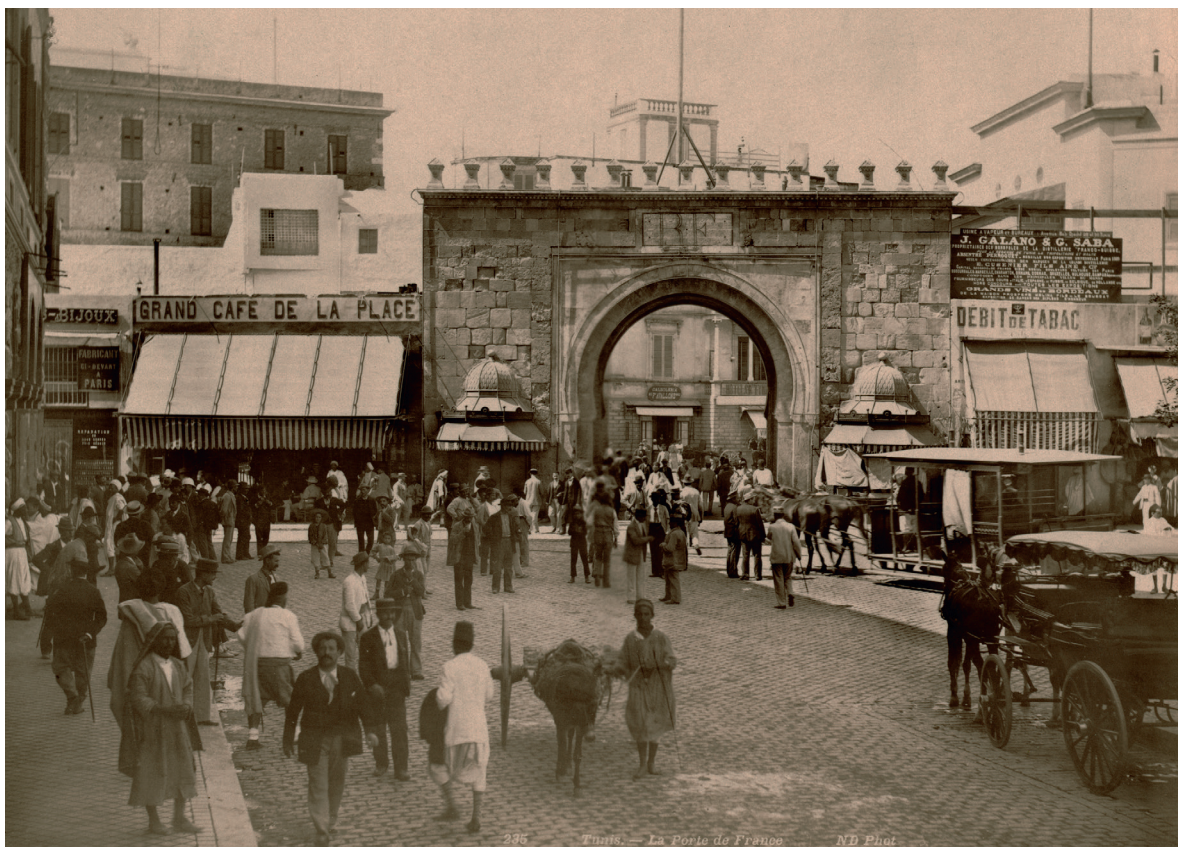
PORTE DE FRANCE La ville arabe est circonscrite par une série de portes crénelées, vestiges des remparts disparus. Bab el-Bhar, la porte de la mer, à la limite orientale de la vieille ville, change de nom sous le protectorat (photo début xx e siècle).

de ville, avenue de Carthage), les édifices de la médina et les boulevards tracés sur l'emplacement des remparts. L'architecture dite coloniale se développe à la faveur de la construction des immeubles, villas et édifices publics qui allient le style, le décor et les matériaux locaux avec les innovations techniques comme l'acier ou le béton.