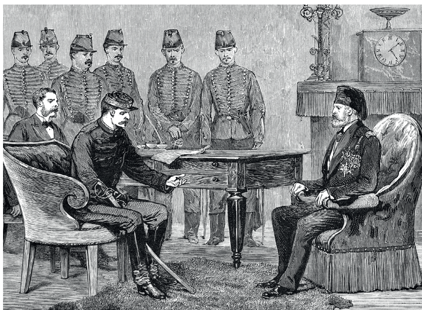
LE TRAITÉ DU BARDO Le 24 avril 1881, 30 000 soldats français basés en Algérie marchent sur Tunis. Le 12 mai, le bey (à droite) doit signer le traité du Bardo, qui établit le protectorat français sur la Tunisie. Il est officialisé en 1883 (gravure du XIX e siècle).