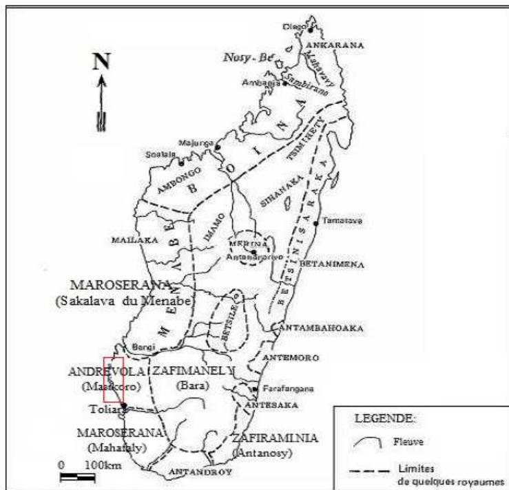
Carte de Madagascar : limites de royaumes