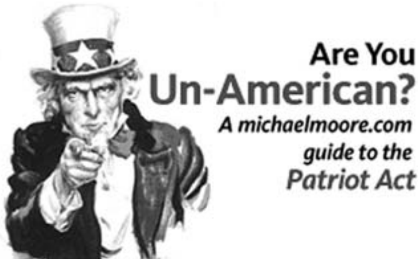
Moores Antwort auf den «Antiamerikanismus-Vorwurf» unter www.michaelmoore.com

Michael Moores Erfolg in Deutschland sucht seinesgleichen: Stupid White Men verkaufte sich mit fast 1,1 Millionen Exemplaren im ersten Jahr besser als in den USA. 9 Seine Lesetour durch deutsche Großstädte im November 2003 anlässlich des Erscheinens von Dude, Where's My Country? wurde zu einem wahren Triumphzug vor ausverkauften Sälen und er fand sich selbst bei Johannes B. Kerner (ZDF: 18.11.2003) wieder. So groß der Erfolg beim zumeist jugendlichen Publikum war, so kritisch-polemisch kommentierten die meisten Qualitätszeitungen seine Auftritte: Die Auseinandersetzung mit Moores nicht unbedingt differenzierten Thesen und seiner Person gipfelt im Vorwurf, er sei ein «Abzocker, ein Konjunkturritter, nicht besser und nicht schlechter als Billy Graham und andere Wanderprediger» 10 wenn nicht gar ein «Kriegsgewinnler» 11 . Besonders die Beschuldigung primitivsten «Antiamerikanismus» zu schüren, zieht sich wie ein roter Faden durch die Feuilletons. Die Welt am Sonntag unkt gar, dass nach dem Kinobesuch eines Moore-Films der USA-Urlaub storniert werde, um das Gewissen zu beruhigen! Des Weiteren wird ein Politologe mit den Worten zitiert: «Bei Michael Moore müsste jeden aufrechten deutschen Linken das Grauen erfassen [...] kein roter Faden, keine große Gesellschaftsanalyse, keine Theorie», stattdessen «eine Sammlung von Impressionen, komplett unwissenschaftlich, mitunter fragwürdig». 12 Was ein «aufrech-