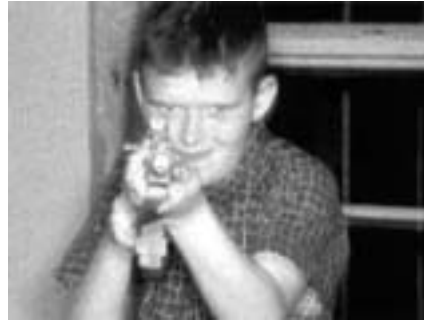
«Little Michael» in Roger & Me und als jugendlicher Sportschütze in Bowling for Columbine