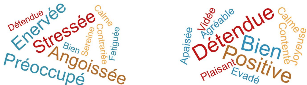
Figure 2. Nuage de mots avant et après expérience.

Les résultats de l'étude peuvent être illustrés par des nuages de mots. Toutes les déclarations négatives recueillies en début d'expérience sont remplacées par des déclarations positives une fois celle-ci terminée. Les deux nuages de mots obtenus renseignent aisément le contraste d'humeur des testeurs avant et après l'expérience ( figure 2 ).